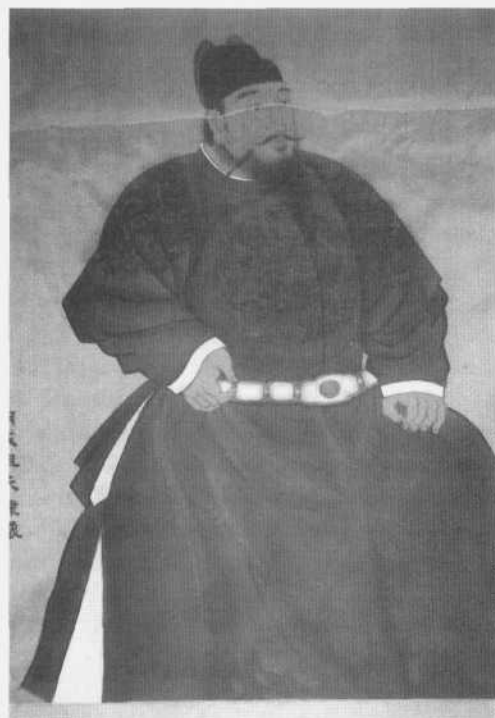
El emperador Zhu Di.

Menzies da mucha importancia al mapa sino-coreano Kangnido de 1420, coetáneo de los viajes de Zheng He, al mapamundi de Waldseemüller de 1507, al de Australia de 1542 de Jean Rotz y a otros más, constancias del histórico periplo. Rotz dibujó un mapa que describió el entorno