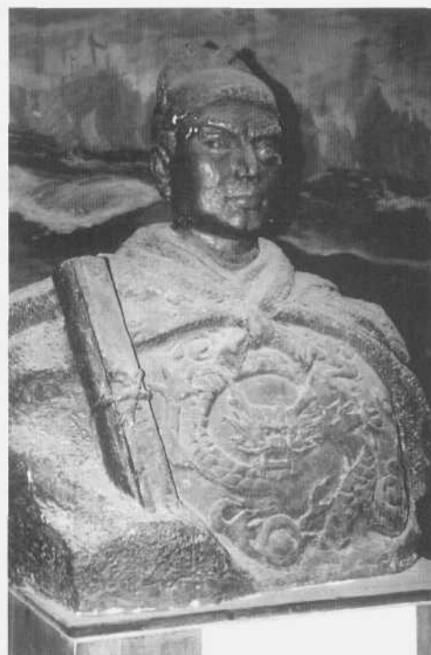
El almirante Zheng He.

De las dinastías chinas, la Ming (1368-1644) fue célebre por su enorme desarrollo agrícola e industrial. Mientras otras dinastías fueron producto de invasiones y hegemonías minoritarias, como la Yuan que fue de origen mongol y la Qing, de origen manchú, la Ming fue han , es decir, propiamente china. Por entonces China alcanzó a vivir en la opulencia y se puede afirmar que estuvo a punto de desarrollar una transformación industrial de trascendencia ecuménica, que no pocos historiadores han comparado con la revolución inglesa en los albores del capitalismo. Se ha dicho que esta revolución china, en condiciones de exportar