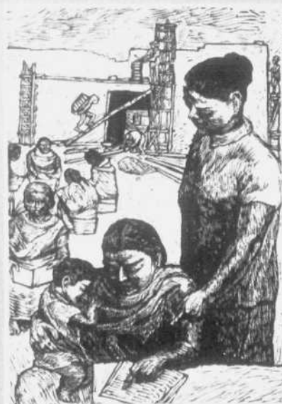
Alfredo Zalce (México)

La globalización se acompaña de una ideología dominante, que se impone en cada país con la realización práctica de sus propuestas centrales, junto a estructuras políticas y de clases que responden a su direccionamiento estratégico, sólo que en la globalización la ideología dominante es la ideología de la potencia dominante, es decir, el neoliberalismo. Esta ideología se propone como un pensamiento único, al tiempo que hace desaparecer del