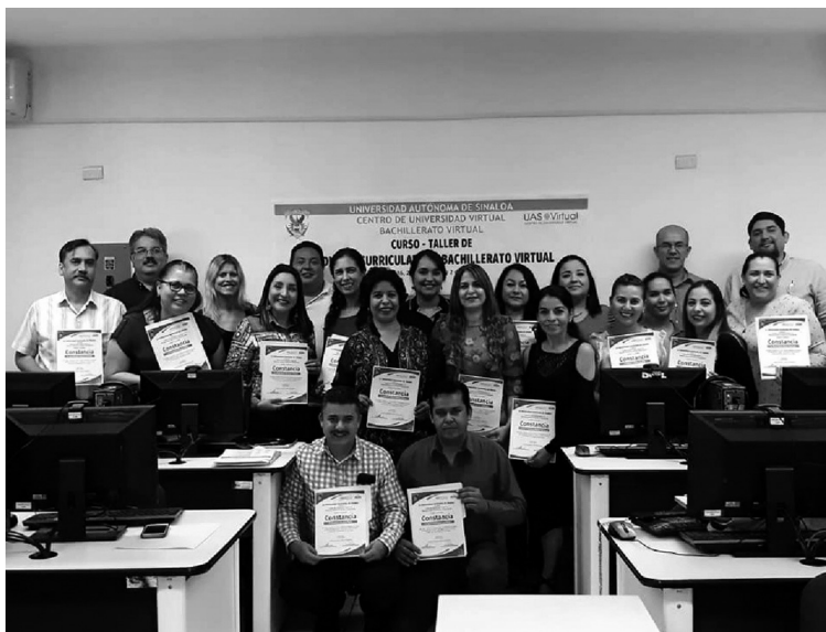
Figura 2. Fotografía de la clausura del Curso Taller de Rediseño Curricular del Bachillerato Virtual, llevado a cabo de febrero a abril de 2018.

ción a la Diversidad (ADIUAS), así como de ir adecuando cuestiones organizativas que nos permitan mejorar y continuar con tan loable labor en nuestro programa.