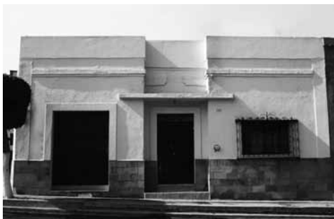
Vivienda con rasgos art déco , en la página 33.

El periodo de análisis del libro coincide con el arranque de la modernidad arquitectónica en México, hacia 1925, estableciendo un cierre temporal en 1960. En él y por medio de los diferentes ensayos que integran el trabajo se establece la evolución de la ciudad y la aparición de los edificios modernos, en el marco de una de las ciudades mexicanas con mayor tradición histórica y monumental respecto a la conserva-