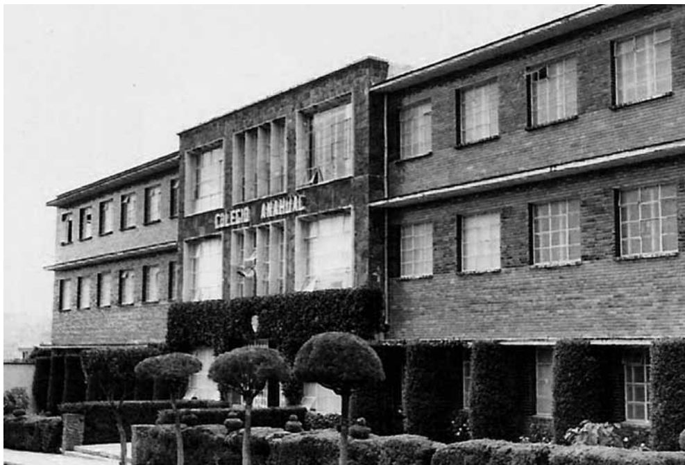
Fotografía antigua del Colegio Anáhuac, en la página 194.