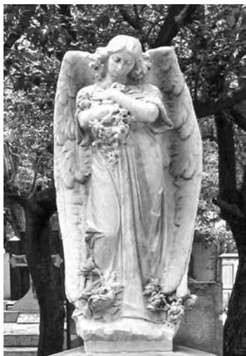
Monumentos funerarios en el Panteón Francés de La Piedad. Fotografías: EMH, pp. 717, 711 y 779 en el libro reseñado