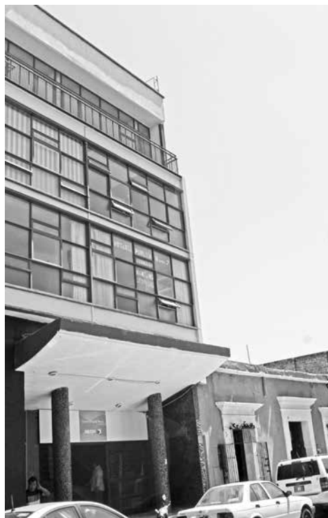
El Movimiento Moderno en arquitectura rompió radicalmente con los esquemas tradicionales de construcción y funcionalidad del entorno construido preexistente, lo que se reflejó en los entornos patrimoniales de todo el mundo, como es el caso del Centro Histórico de Oaxaca, México.

Afortunadamente esta tendencia se ha ido frenando y en diversos sectores de la sociedad se va reconociendo su irracionalidad. Este cambio ha hecho que diferentes estratos de la comunidad hayan vuelto a ver el pasado para tratar de abrir nuevas alternativas en la desaforada carrera por el desarrollo. Así, se han generando valiosas acciones de recuperación de estructuras preexistentes bajo premisas de tipo cultural, económico y ecológico.