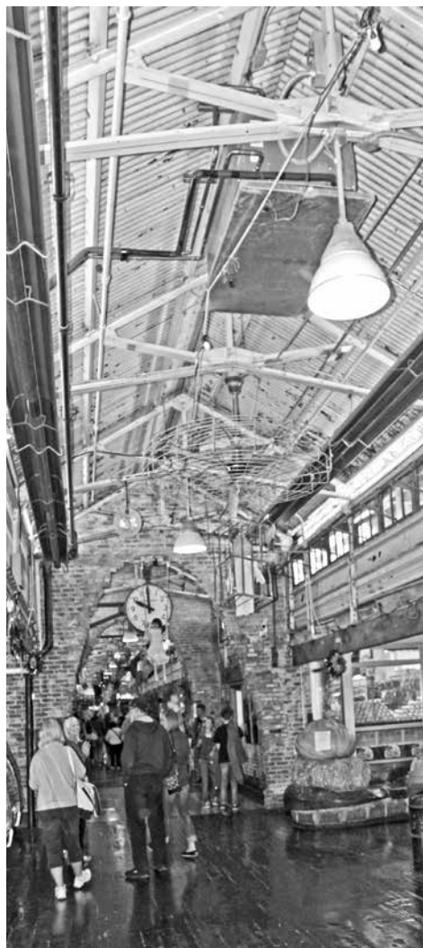
Cada vez más se amplía el “tipo” de edificios susceptibles de ser reutilizados, donde los valores de ubicación, de costo y oportunidad toman un protagonismo importante, como es el caso de este antiguo rastro en Nueva York convertido en centro comercial. Fotografía: JSL, 2014

para aprender de la manera en que se han reutilizado en otras épocas. Estos aspectos muestran el amplio radio de acción que tiene la reutilización arquitectónica, específicamente el proyecto como ejercicio y responsabilidad de diseño, que no se limita a una acción ‘conservadora’ única.