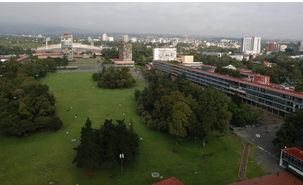
Vista del campus central en dirección al norponiente, desde la Torre II de Humanidades.

ésta [la zona escolar] tiene como elemento central y dominante el campus universitario, elemento de máxima importancia, no sólo en la composición del proyecto de conjunto, sino por su función destacada y valor moral, puesto que además de ser su elemento central, limitado por los edificios escolares, sirve como enlace de éstos y como gigantesco patio que constituye el lugar de reunión e interrelación de la comunidad universitaria. 3