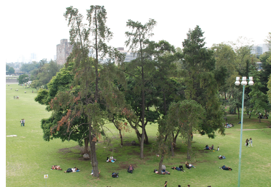
Vista hacia el poniente, en la que se ve en primer plano un bosqueque intruso en la idea original de vegetación de la explanada, además de una lámpara de poste. Fotografía: Andrea Berenice Rodríguez Figueroa y Diana Ramiro Esteban, 2017.

Más allá de los árboles, la especie vegetal que caracteriza a Las Islas es el césped, el cual se pensó originalmente solo como junteo del pavimento de piedra; con el tiempo ganó espacio y la cubrió mayormente, hasta resultar en lo que vemos hoy, una gran explanada verde. Un corte imaginario a lo largo de la explanada mostraría en el fondo un suelo accidentado de piedra volcánica, en algunos puntos con profundidades hasta tres y medio metros, 31 encima un relleno de tepetate para lograr una superficie plana y una cama de arena sobre la que se asientan bloques de piedra volcánica de 30 cm de peralte, separados entre sí por