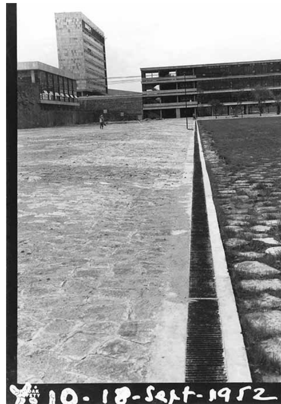
Pavimento de la plataforma poniente (izquierda) a base de roca volcánica colocada a hueso y pavimento de la explanada de Las Islas (derecha) construido con bloques de roca y juntas de tierra vegetal, 18 de septiembre de 1952.

Mario Pani y Enrique del Moral refieren a un solo espacio arbolado en el conjunto de Ciudad Universitaria, al que singularmente relacionaron con una alameda; se trata del ubicado frente a la fachada poniente de la Facultad de Medicina: “Sus edificios [los del conjunto original de Ciencias Biológicas] se agrupan alrededor de una gran plaza, al oriente del campus y de la Facultad de Ciencias, a la que se le dio el carácter de alameda, tratamiento que la diferencia francamente del campus”. 14