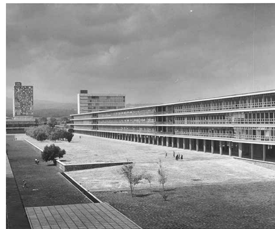
Vista de la plataforma norte, con el edificio de Humanidades y Comercio, hoy Facultad de Filosofía y Letras, con las hileras de jacarandas en cajetes cuadrangulares, ca. 1953.

En el andador o plataforma sur, y como parte del plan original, se dio espacio a dos filas de fresnos o posiblemente de álamos (no se tiene bien identificada esta vegetación) que igual que en otros espacios de