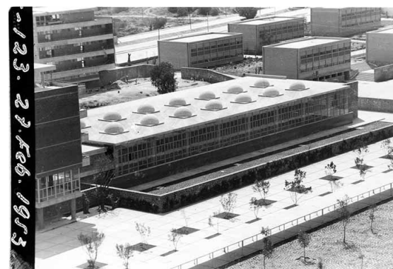
Vista desde la Torre de Ciencias (hoy Torre II de Humanidades) en dirección a la Facultad de Ingeniería y a la plataforma sur, con las dos hileras de especies arbóreas y los fresnos dentro de la explanada de Las Islas, 27 de febrero 1953. ISSUE/AHUNAM/Colección UNIVERSIDAD/Construcción de CU/CU-002783.