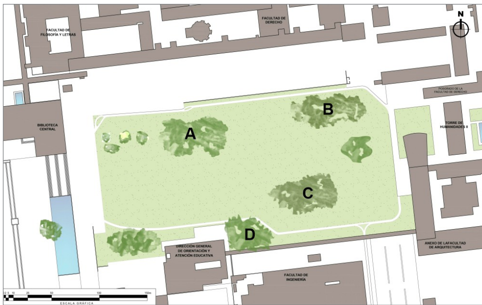
Croquis explicativo de Las Islas. Elaboración: Andrea Berenice Rodríguez Figueroa y Diana Ramiro Esteban, 2020.

A la par de la formación de los montículos, sobre cada uno de ellos se plantó un bosque: en el del norponiente (A) frente a la actual Facultad de Filosofía y Letras, con jacarandas; en el del nororiente (B), frente a la ahora Facultad de Derecho, con álamos; en el montículo suroriente (C), frente a la que era entonces la Escuela de Ingeniería, con jacarandas; y en el que se hizo en el costado oriente del antiguo Club Central, edificio ocupado actualmente por DGOSE (D), con fresnos. Este proyecto de arbolado buscaba el contraste entre colores y frondas: el morado propio de las flores de las jacarandas y su estacionalidad con el verdor y estacionalidad de los fresnos y el carácter caducifolio y el color plateado de los álamos. Hoy, de este proyecto, solo restan algunos ejemplares; muchos murieron y fueron remplazados con individuos de otras especies. 27