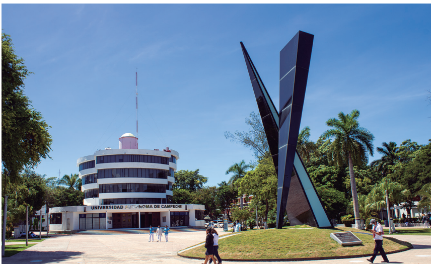
Figura 10. Escultura geometrística y la Torre de Rectoría (2022).