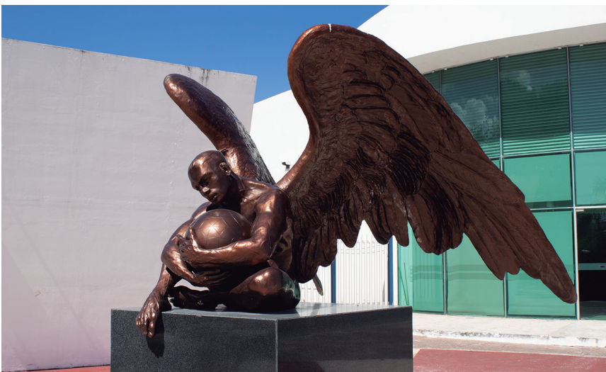
Figura 12. Escultura neofigurativa en la plaza de acceso del Centro Cultural Universitario (2022).