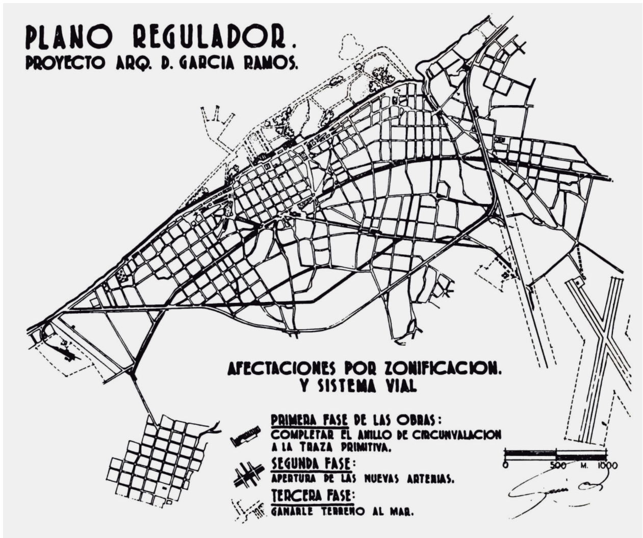
Figura 1. Plano Regulador de Domingo García Ramos, 1952.

Las directrices de las políticas públicas de Trueba Urbina, en función de sus criterios urbanísticos y arquitectónicos, eran lograr una ciudad contrastante, manteniendo sus raíces coloniales en un extremo y retadoramente nueva mirando hacia el futuro. Durante el discurso de Trueba Urbina, con fecha 7 de agosto de 1957, en el cual se celebraba el centenario de la constitución de Campeche como estado, destaca al “Campeche Nuevo” como una obra vigorosa que significaba la construcción de una nueva ciudad, digna y de las mejores. 4