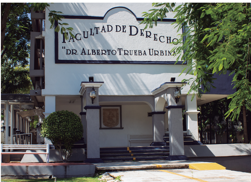
Figura 5. Acceso lateral de la facultad de Derecho con arcadas neocoloniales (2022).

En el complejo de la UACAM se emplazaron fuentes, arcadas en espacios exteriores con una tendencia neocolonial, se utilizaron luminarias con farolas similares a las utilizadas en el siglo XIX e inicios del XX. Así mismo proliferaron bustos en pedestales neoclásicos de los primeros rectores, a lo que fueron muy proclives los responsables del departamento de obras, por un culto a la personalidad, muy a pesar de que algunos rectores tuvieron actuaciones muy discutibles durante periodos posteriores cercanos a la matanza de estu-