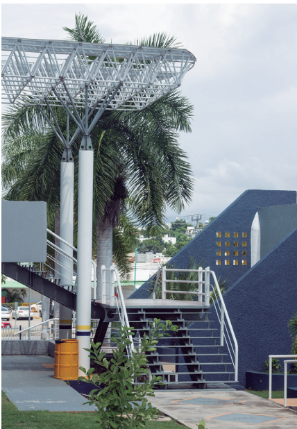
Figura 8 (der). Acceso lateral del edificio de Posgrado (2022).