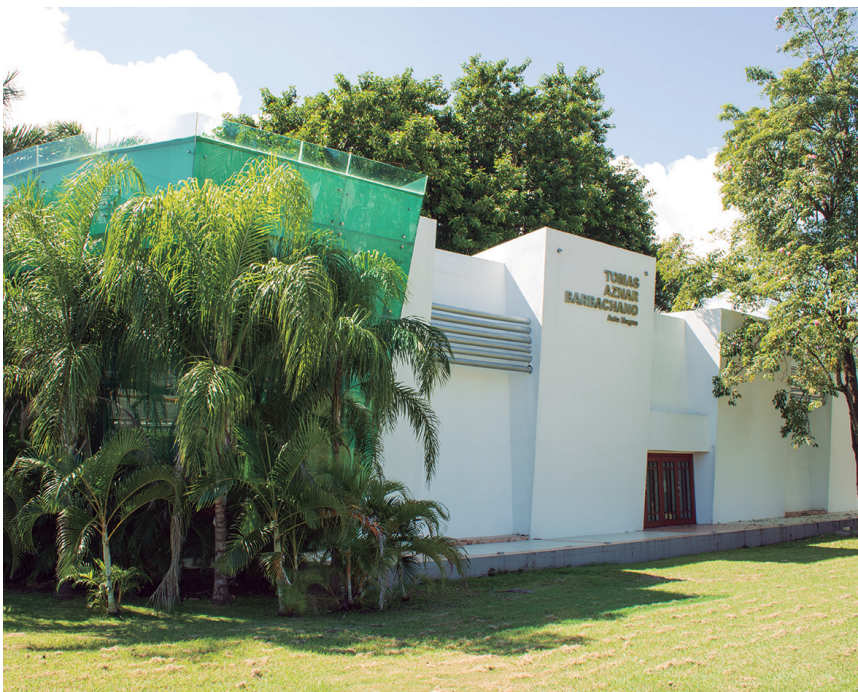
Figura 9. Fachada noroeste del Aula Magna (2022).

En cuanto al comportamiento ambiental de los inmuebles, con respecto a su diseño, se observan dos deficiencias marcadas, una es la inexistencia de ventanas para permitir ventilación y soleamien-