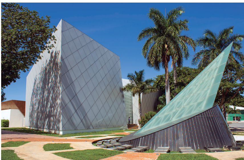
Figura 11. Centro Universitario de Exposiciones (2022).

Tipo 4 – Durante la segunda década del siglo XXI y la gestión gubernamental de Alejandro Moreno Cárdenas (2015-2019), se observó un desborde de la oferta educativa de la UACAM como respuesta