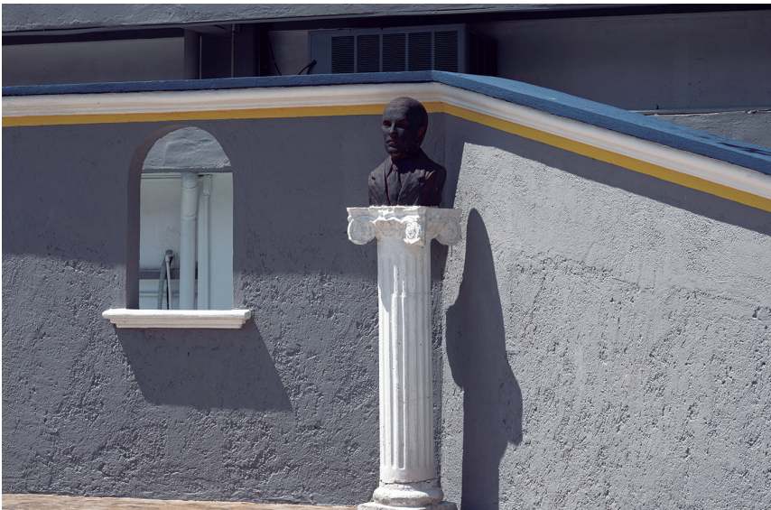
Figura 6. Plazoleta adjunta a la facultad de Derecho con un busto (2022).