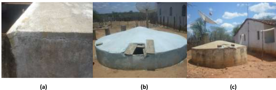
Figura 3. Rachadura (a) e estado de conservação das tampas de cisternas em Lajedo – PE (b) (c)

Os resultados obtidos quanto aos aspectos estruturais, mostram que 24% das cisternas apresentaram rachaduras (Figura 3a). As rachaduras das cisternas, além de vulnerabilizarem a qualidade da água por serem pontos de infiltrações, indicam a ausência de manutenção dos sistemas. Em contra partida, verificou-se que a maioria das cisternas possuía tampa, num percentual de 76%, embora nem todas se apresentaram em perfeito estado de conservação ou eram adequadas, conforme mostra a Figura 3b e 3c, propiciando também possível contaminação da água, conforme afirmam Meira Filho et al. (2009)