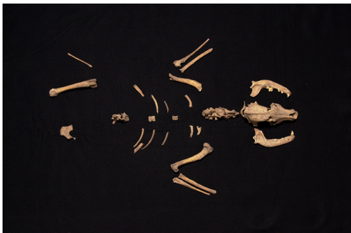
Figura 3. Hembra de perro encontrada en Huixtoco, la cual se presume fue cocinada y después armada, para colocarla junto a un difunto humano.

otros de tierra firme (Serra y Valadez 1986). En su colección arqueozoológica aparecieron peces, patos y tortugas, así como organismos de tierra firme, que muestran el aprovechamiento simultáneo de recursos provenientes de diversos ambientes en Huixtoco.