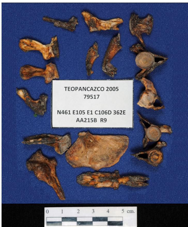
Figura 4. Huesos diversos del pez bobo ( Joturus pichardi ) descubiertos en Teopancazco. Es una especie propia de lagunas costeras explotado como alimento desde tiempos muy antiguos por los habitantes de la zona.

Otro grupo ilustrativo fueron perros de patas cortas o tlalchichis (Valadez 1995; Valadez et al. 2012) los cuales abarcaron un total de 11 individuos cuya temporalidad abarcó los siglos III a V de nuestra era. Los restos aparecieron asociados a entierros, en rellenos y en espacios vinculados con la manufactura o el manejo de animales y/o sus partes. Un individuo presentó marcas de corte, otro huellas de mordidas y siete tenían evidencia de haber sido cocidos.