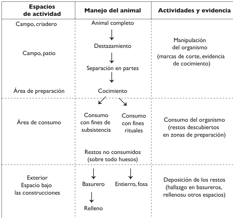
Figura 2. Diagrama del manejo, "probable", de consumo de elementos cárnicos en la época prehispánica (elaborado por Raúl Valadez).

Un entierro tenía asociada a una perra de poco menos de un año de edad en posición anatómica; parte del esqueleto no apareció, por ejemplo la pelvis, cola, manos y pies; los nasales, vértebras lumbares, tibias y costillas presentaron marcas de corte y en general los huesos aparecían como cocidos o carbonizados. Se concluyó que esta perra había sido sacrificada, desollada, destazada, cocida, comida, sus huesos vueltos a armar y finalmente colocada junto al difunto (figura 3).