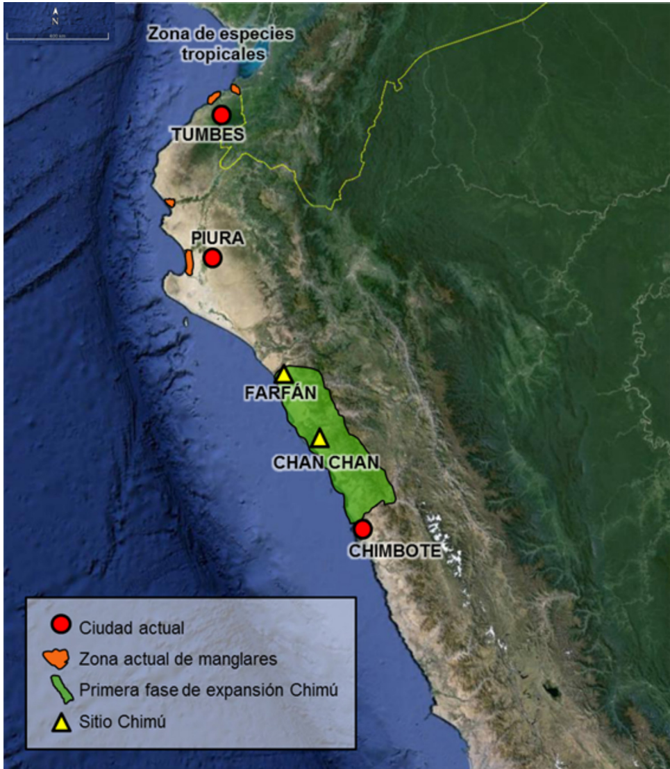
Figura 3. Ubicación de diferentes áreas implicadas en la obtención de la malacofauna registrada en el conjunto amurallado Xllangchic-An.

durante el proceso de elaboración. Las formas de trabajar estos moluscos son retirando el ápice o perforando transversalmente la concha para finalmente ser atravesados por delgadas cuerdas. La manera de aprovechar a los moluscos para este tipo de uso fue parte de un continuum cultural presente desde épocas tempranas hasta periodos tardíos (Matsuzawa y Shimada, 1978; Proulx, 1999; Habetler, 2007; Vásquez et al., 2003) y era realizado por distintos grupos sociales, siendo la única diferencia el tipo de especie utilizada como materia prima para la elaboración de estos objetos (fig. 4); todo esto queda demostrado no solamente con la recurrencia de diversas especies dentro de las excavaciones, sino también por la representación de su uso en la cultura material.