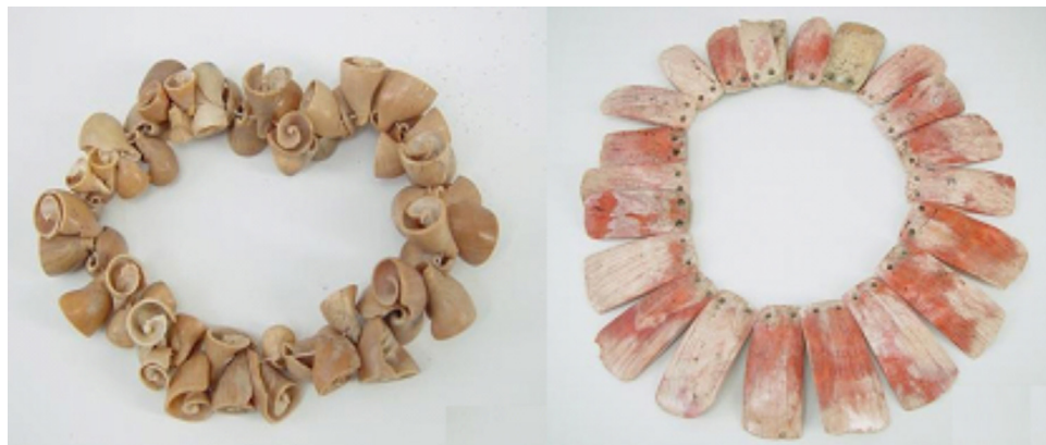
Figura 4. Empleo de diferentes especies de moluscos para la elaboración de ornamentos en diferentes culturas: pulsera mochica hecha de Prunum curtum (izquierda) y collar nazca de Spondylus princeps (derecha) (piezas del Museo Larco ML200008-ML200006).

También otras especies de moluscos, como la Pinctada mazatlanica , Choromytilus chorus , Spondylus princeps y Conus fergusonii , fueron empleadas en la confección de cuentas y pequeñas figurillas (abalorios) o para incrustaciones dentro de otros objetos (Jackson, 2004; Capriles, 2002), aprovechando así la dureza de la concha; en el caso de la primera especie, llamada «ostra perlera», también fue muy utilizada por el abundante nácar que posee en su composición, el cual facilita la elaboración de variadas esculturas con diversas formas que el artesano quisiera plasmar; evidencia de este tipo de aprovechamiento fue lo hallado en el sector de depósitos durante las excavaciones.