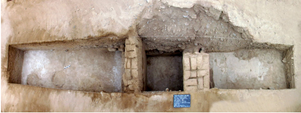
Figura 5. Presencia de pigmentos blancos en los pisos de los diferentes ambientes (derecha e izquierda son depósitos y el centro es una vía de circulación) en el sector de almacenamiento.

como ingredientes; asimismo considerar a estas especies simplemente como fauna acompañante y sin ningún valor económico estaría errado, ya que no se encuentran en un entorno de recolección y/o de consumo directo, además un contexto de almacenamiento no permite la presencia de este tipo de material puesto que los bienes acopiados presentan un valor económico y para llegar hasta estos ambientes deben ser seleccionados, siendo depositados solamente los bienes que puedan ser aprovechados luego en alguna actividad cuando se les necesite. Todo esto respondería a la gran presencia de Donax sp. (8330 NISP/4818 NMI) y, aunque normalmente se asocia este bivalvo a actividades de consumo, en esta ocasión la naturaleza de su presencia es otra, dado que luego de ser utilizada como parte de la dieta local en un instante anterior a su almacenamiento, al igual que el Choromytilus chorus , las valvas de este molusco son acopiadas en este sector para luego ser utilizadas con fines industriales muy variados.