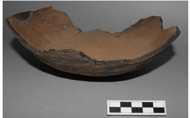
Figura 3. El cuenco en el laboratorio (escala en cm.)

bargo, desde la perspectiva propuesta aquí, el poder de las cosas va en otra dirección y genera verdaderos niveles de movilización, poder y presencia social para recuperar la idea Heideggeriana. La ritualización de este acto no es una copia fiel de lo que mencionan Bowen y Moser (1968) ni necesariamente en la espiritualidad que describe Rentería (2007). Es actual, es viva, y pese a que es diferente, en el fondo aspira a cumplir los diversos momentos rituales de la totalidad mitológica, como a continuación expongo.