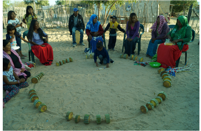
Figura 5. Fiesta de la Pitahaya.