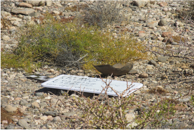
Figura 1. Cuenco asilado como elemento arqueológico.

del desgrasante orgánico. El grosor va de 3 mm a 5 mm, con una tendencia a ser más gruesos regularmente. Las formas siguen siendo las mismas, cambiando la base de cónica a globular (figura 2).