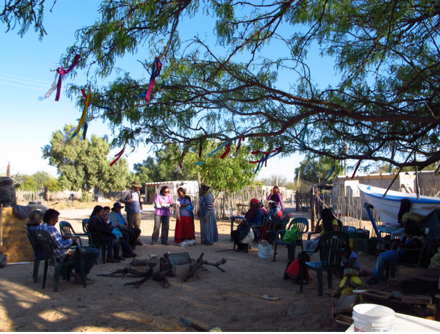
Figura 4. Preparativos la fiesta.

total de 40 espacios a forma de casillas, en las cuales se depositaban ramas decoradas con pintura y un listón a manera de “fichas”, mismas que avanzaban al azar. La primera que lograra dos vueltas ganaba todos los objetos que apostaron al principio del juego y se colocaron en una charola. El juego es un sistema sencillo que, además de ser una forma de socialización, es una forma de movilización de recursos que pueden ser desde un collar hasta grandes sumas de dinero, puesto que la esencia del juego, es literalmente la apuesta (figura 5).