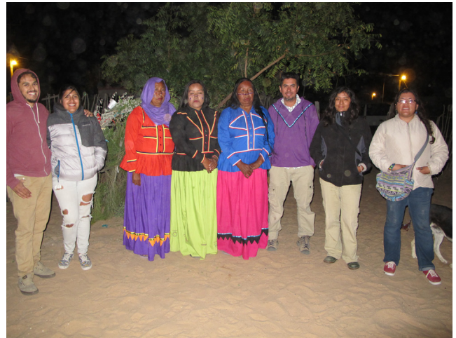
Figura 7. Entrega de la vasija purificada, El Desemboque de los Seris.

Los rituales comcáac tienen precisamente esta función, independientemente si adoptamos la visión espiritista descrita por Rentería (2007) o la pragmática, descrita por Bowen y Moser (1968) que dicta que al encontrarse un objeto antiguo hay que hacerle una fiesta para alejarnos de todos los males contenidos en el simple acto de haberla perturbado. Los males se contrajeron en el acto de encontrarla. En el fondo, la vasija se escondió de los demás y apareció solo ante quien tuviera el poder de articular el reingreso al mundo de los vivos.