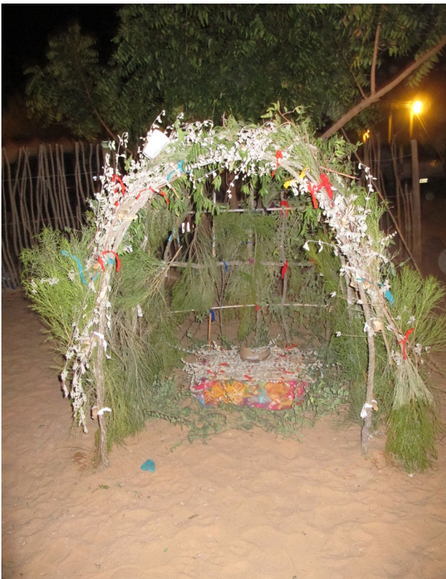
Figura 6. El altar de la vasija.

En un sentido más integral, creer en el poder de los objetos ha generado una amplia movilización de ideas y significados. La celebración fue un acto social de compartir el interés en el pasado a través de creer en la vida social de las cosas. La interacción se dio de una manera recíproca,