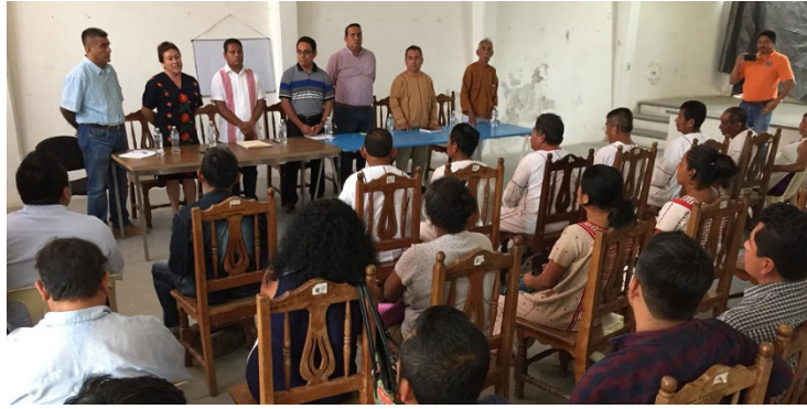
Figura 1.