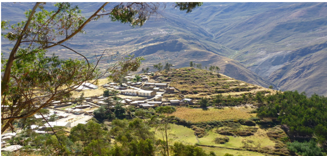
Figura 1. Fotografía de la comunidad de Santiago de Maray en la actualidad.

299564 este y 8790682 norte, el cual estuvo habitado desde la época colonial hasta 1970, año en el que se cambió su ubicación debido al fuerte terremoto de ese año (Noriega 2015: 340). Esto lo pude corroborar en conversaciones informales y entrevistas realizadas a los comuneros, en 2010, 2013, 2016 y 2017 6 . Entre el Maray ‘moderno’ y el Maray ‘viejo’ o colonial, hay una distancia de dos kilómetros que se pueden recorrer a pie, a través de un camino de herradura o en carro (Noriega 2011: 71).