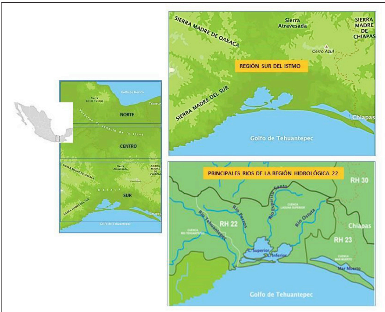
Figura 1. Regionalización del istmo de Tehuantepec; rasgos fisiográficos generales y principales ríos de la cuenca hidrológica 22 en la región sur (reelaborado de https://es.wikipedia.org/wiki/Istmo_de_Tehuantepec ).

De acuerdo con Campbell (1994), la región fue escenario de múltiples contactos entre pueblos ikook, chontales, zoques, nahuas, mixtecos, mixes y zapotecos. La historia de su ocupación se remonta por lo menos 3500 años, de ello destaca que la respectiva cronología pudo ser elaborada a partir de los datos obtenidos principalmente en la cuenca baja del río Los Perros, en cuyas márgenes se registró el mayor número de asentamientos y materiales arqueológicos diagnósticos (Delgado 1965;