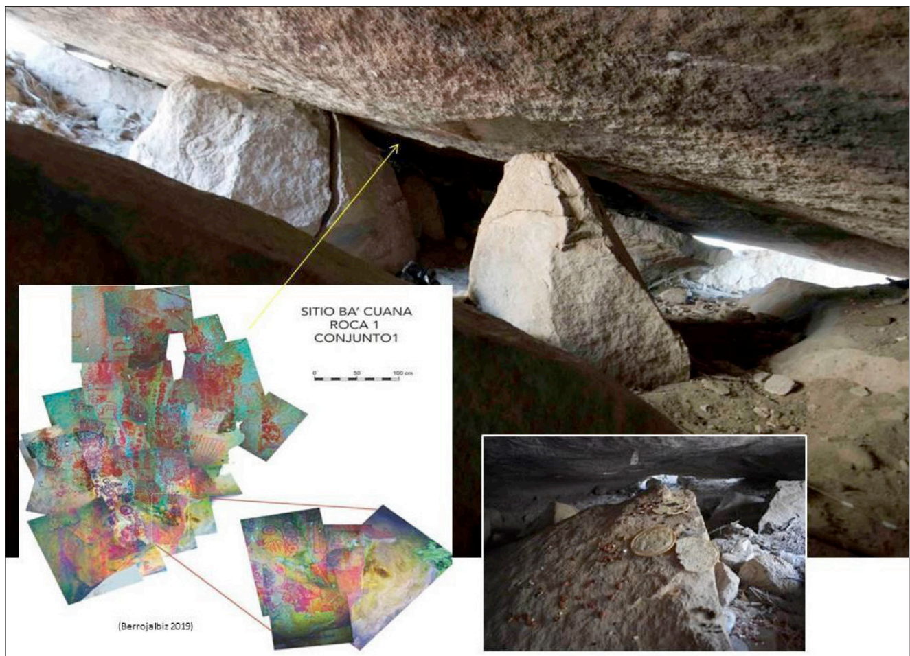
Figura 2. Interior del abrigo 1 en el sitio Ba'cuana; registro fotográfico del Conjunto 1 (Reelaborado de Berrojalbiz 2019); y disposición de ofrendas actuales a su interior (Imagen de F. Flores 2022).

Es impropio desvincular el paisaje de la dimensión espacio temporal de cualquier fenómeno humano (Thomas 2001, 2008; Ingold 2000), por lo que consideramos dichas manifestaciones como un primer registro etnobiológico y como entidades activas que, a finales del periodo Clásico y durante todo el Posclásico, participaron tanto en los discursos simbólicos implícitos en la construcción y apropiación de los espacios, como en los entramados hombre biota en la región (figuras 2 y 3).