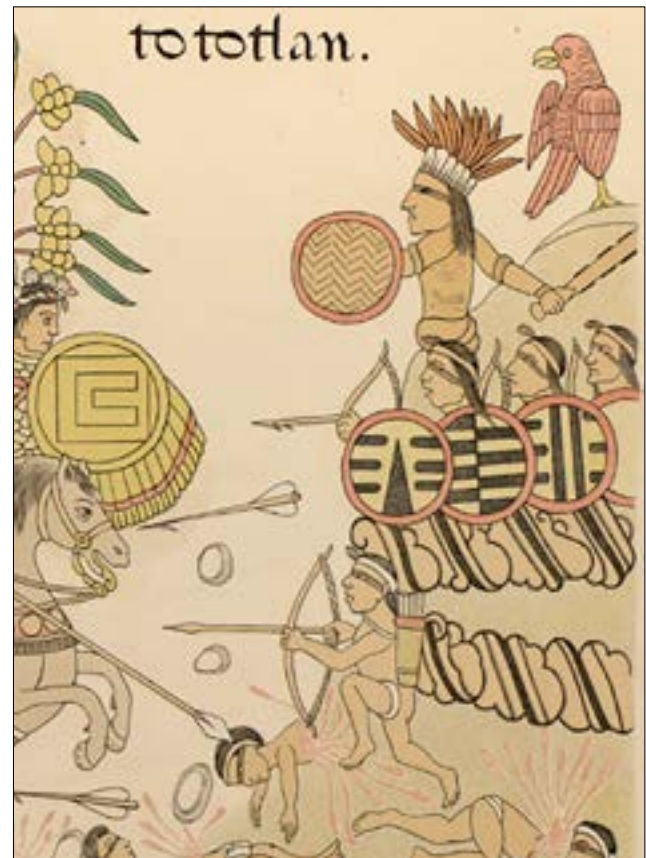
Figuras 3 y 4. Aquí se registran la panoplia de los tecoxquines de Xalixco y los tecuxes de Cuinao-Tototlán; sólo los tecuxes aparecen usando macuahuitl , mientras los grupos de la costa y valles de Nayarit lo usaban menos.

podía resistir impactos directos como lo haría una espada. Esencialmente era un arma de corte que podía desgarrar tejidos—causando infecciones debido a las microlascas—, así como provocar pequeñas fracturas en los huesos, pero no era capaz de amputar miembros completos (Cervera Obregón 2007: 65). Entonces, probablemente, un guerrero portador de macuahuitl centraría su ataque fundamentalmente en los miembros del oponente, más que a su torso, que con frecuencia estaba mejor protegido. En ocasiones se le ha llegado a comparar con la espada hispana, incluso, se le ha llamado espada mesoamericana (Roper 1996); pero, el macuahuitl no tiene un equivalente exacto en el armamento hispánico, ya que no sirve para punzar. A diferencia del arco y la flecha o los lanzadardos ( atlatl ), cuyo uso era más amplio, incluso como instrumento de cacería, el macuahuitl no tenía otra finalidad más que la bélica.