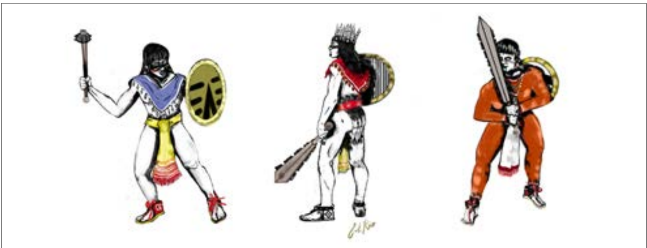
Figura 8. Recreación de los guerreros tonaltecas con porras y macahuítl de acuerdo con las fuentes escritas y pictográficas del siglo XVI.

Regresando al análisis de la imagen referida (lámina 55), el guerrero luce pintura facial en los ojos, una mantilla o quechquemítl corto con cascabeles ( coyolli ), chimalli , maxtlatl y un protector o faldellín de plumas en la parte posterior. En la lámina se logra distinguir que es un guerrero de la élite, puesto que muestra una indumentaria mucho más compleja a la del resto de los combatientes tonaltecas, además de estar representado de cuerpo completo en primer plano. Porta un macahuítl de pequeño (8 navajas en total) con una curiosa punta y un doble biselado. La representación tan específica y fiel de esta arma indica que probablemente los guerreros tlaxcaltecas se llevaron algún ejemplar como trofeo de guerra de vuelta a su región de origen, por lo cual pudieron retratarlo fielmente.