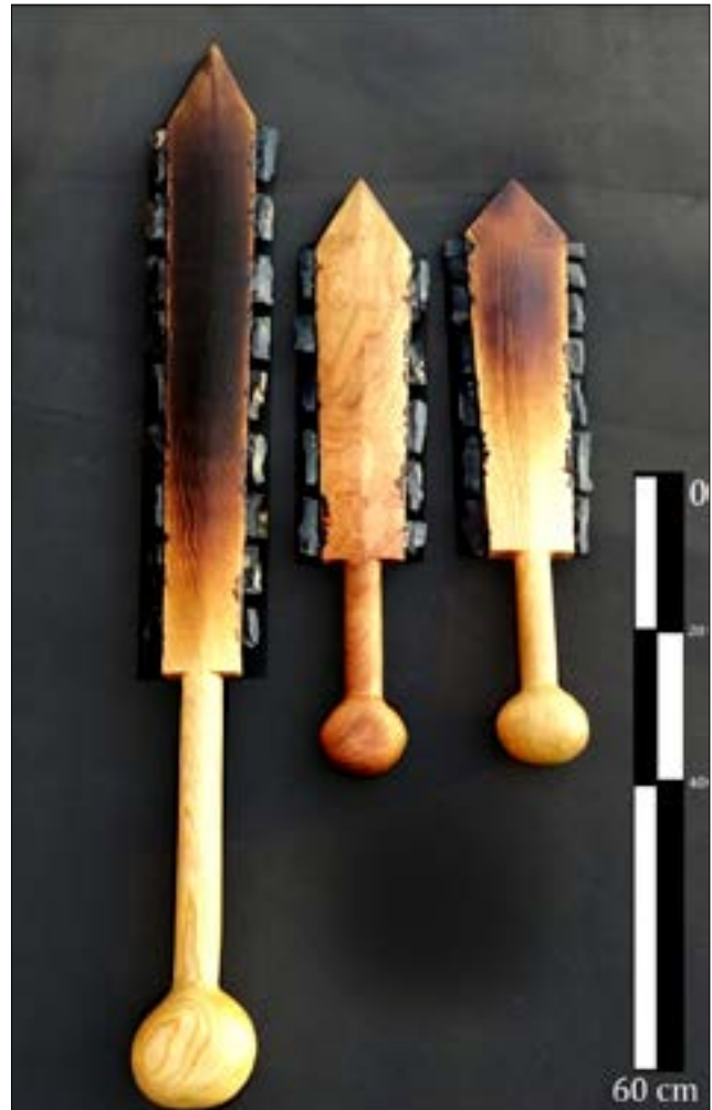
Figura 10. Vista de los tres prototipos realizados para esta investigación, de izquierda a derecha: macuahuitl largo o mandoble elaborado en pino (c), macuahuitl corto de mezquite (b) y macuahuitl de pino (a).

de formato pequeño (cuatro navajas por lado); sin embargo, como ya se dijo, las fuentes escritas mencionan la existencia de estas armas en formato mayor o mandobles. Por lo tanto, para el experimento se elaboraron en los dos formatos, grande y pequeño, para corroborar su eficacia.