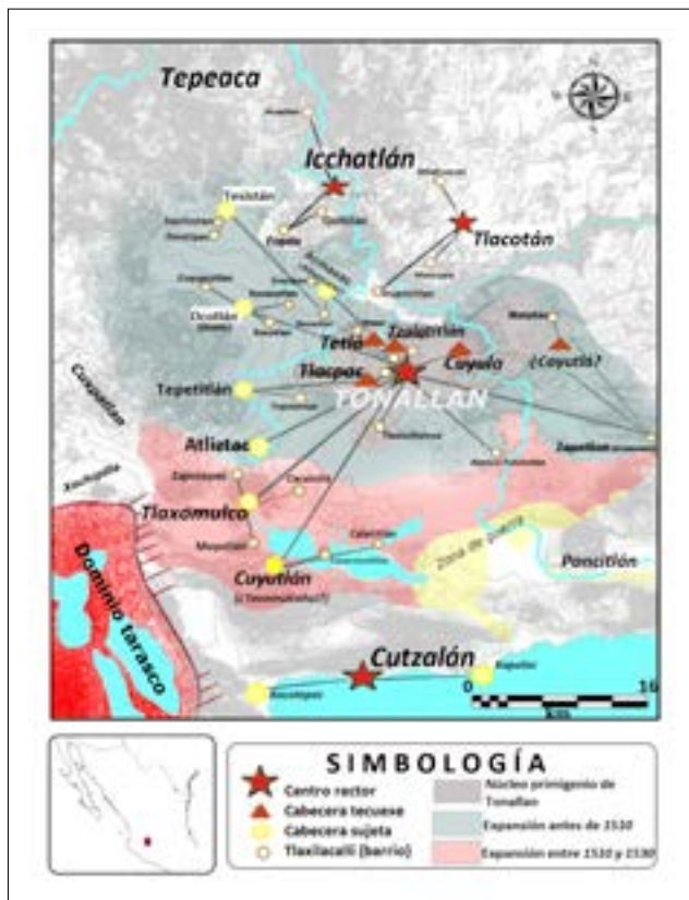
Figura 5. Extensión y expansión del altépetl tonalteca décadas antes de la conquista hispana.