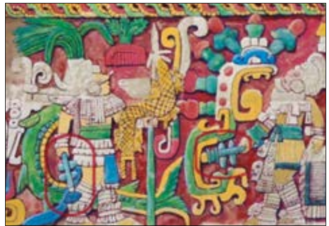
Figura 2. Murales de Chichén Itzá pintados por Adela Bretón donde se aprecian guerreros portando artefactos similares al macuahuitl , pero con solo cuatro navajas.

En el Posclásico temprano, en Tollan-Xicocotitlan las armas más representadas en su iconografía son: escudos, lanzas, lanzadardos, cuchillos y una banda acolchada de algodón para proteger el brazo izquierdo (Jiménez García 2007: 55). Analizando detenidamente la iconografía, el armamento tolteca era dominado esencialmente por los lanzadardos, además de algunas innovaciones como los “mazos curvos con navajas” (Hassig 2007: 34-36); pero en general, el uso extensivo de los atlatl refleja una gran continuidad con respecto al armamento teotihuacano. De la misma manera, en los murales de Chichen Itzá registrados por Adela Bretón se aprecian unos artefactos pequeños de cuatro navajas (dos navajas por lado) y en la punta una decoración de plumas o piedras preciosas (figura 2). La forma de las navajas parece puntiaguda, lo cual podría indicar que su uso no era para cercenar o cortar, sino para apuñalar. Así pues, el diseño recuerda al macuahuilzoctli –versión más pequeña del macuahuitl –, pero su función es distinta. Sin embargo, el arma predominante en las representaciones de Chichen Itzá siguen siendo los lanzadardos a atlatl .