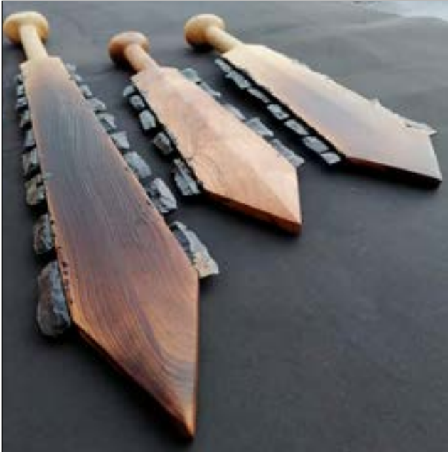
Figura 1. Los tres prototipos de macuahuitl se realizaron, sin escala, durante la investigación entre septiembre y octubre de 2023.

El macuahuitl era un arma compleja y tardía en el contexto mesoamericano, data del Posclásico medio y tardío (1100-1521 dC). Los primeros indicios de su uso son en la zona maya, en forma de mazos con puntas de pedernal, durante la fase final del Preclásico (Cervera Obregón 2007: 62, 64, 65). Incluso se han detectado posibles antecedentes en la iconografía olmeca (Garduño 2009: 107; véase figura 1). El arqueólogo Marco Cervera (2007: 65) atribuye su invención a los grupos del centro de México, y la sitúa temporalmente entre la caída de Tula y el surgimiento del Estado mexica, es decir entre los siglos XII y XIV dC.