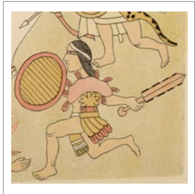
Figura 7. Detalle de la Lám. 55 del Lienzo de Tlaxcala , en la cual aparece un guerrero con macahuítl con punta, doble biselado y pomo esférico. Su atavío incluye un faldellín de plumas, maxtlatl de algodón y una especie de quechquemítl corto con cascabeles de cobre. Fuente: Chavero (1892). Lámina 55.

Como se había mencionado, en Tonalá, Nuño de Guzmán y otros conquistadores señalan el uso extensivo de varios tipos de porras, macanas y en especial del macahuítl (figura 8), muchos de ellos eran elaborados con madera (Iturriaga 2009:19; Razo 1982). Sin embargo, en la lámina 55 del LT aparece una variante muy singular: un macahuítl con punta (figura 7), doble biselado y con una empuñadura con pomo esférico. Este pomo es llamativo, ya que recuerda más al de una porra que al de un macahuítl , ya que usualmente eran en forma de aro, entre los nahuas era conocido como chalchihuitl . Cabe mencionar que chalchihuitl significa “piedra verde preciosa”. Regularmente se asocia con minerales altamente valorados como el jade, malaquita o serpentinas; en la cosmovisión mesoamericana esta palabra también se usaba como sinónimo de precioso o valioso, extendiéndose de manera metafórica a otros objetos como el corazón o la esencia humana. Su asociación con la empuñadura de un arma estaría relacionada con el sacrificio y la sacralización de la guerra, así como su papel en el ciclo de la vida (León Portilla 2015).