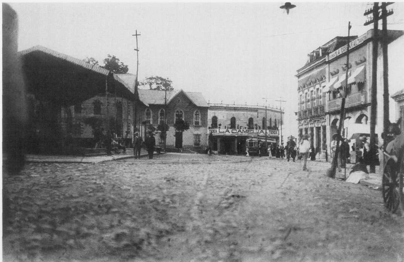
Plaza de San Jacinto

que se acercaban a lo lejos al convento de Churubusco, en donde el general Pedro María Anaya entregaría su espada al comandante estadounidense luego de la fiera defensa mexicana, pronunciando la célebre frase: Si tuviéramos parque, no estaría usted aquí. Y aquí, en la plaza, fueron colgados días después los prisioneros irlandeses sobrevivientes del Batallón de San Patricio, que desertaron del ejército invasor para luchar hombro con hombro con las tropas mexicanas, como reza la placa expuesta en el muro de una casona del lado poniente. Unas décadas más tarde, en plena Revolución Mexicana, era común ver por este sitio a las avanzadas zapatistas, que bajaban de sus santuarios en la serranía del Ajusco para tomarse unos tragos de pulque o de mezcal en las cantinas del rumbo.