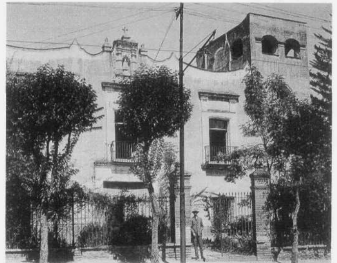
La Casa del Risco con su mirador.

Desde el mirador de la Casa del Risco, Manuel Payno, el autor de Los bandidos de Río Frio , observó un día de agosto de 1847 los movimientos de las tropas yanquis