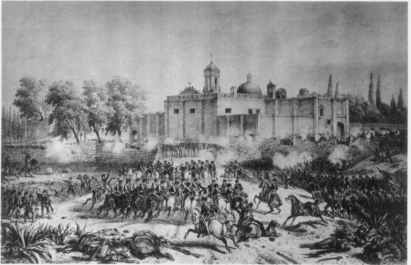
La intervención Americana. Batalla de Churubusco. Litografía.

importancia que la gente comenzó a referirse al pueblo con su nombre, San Ángel. Es interesante la descripción que hace del lugar Madame Calderón de la Barca, allá por 1841: