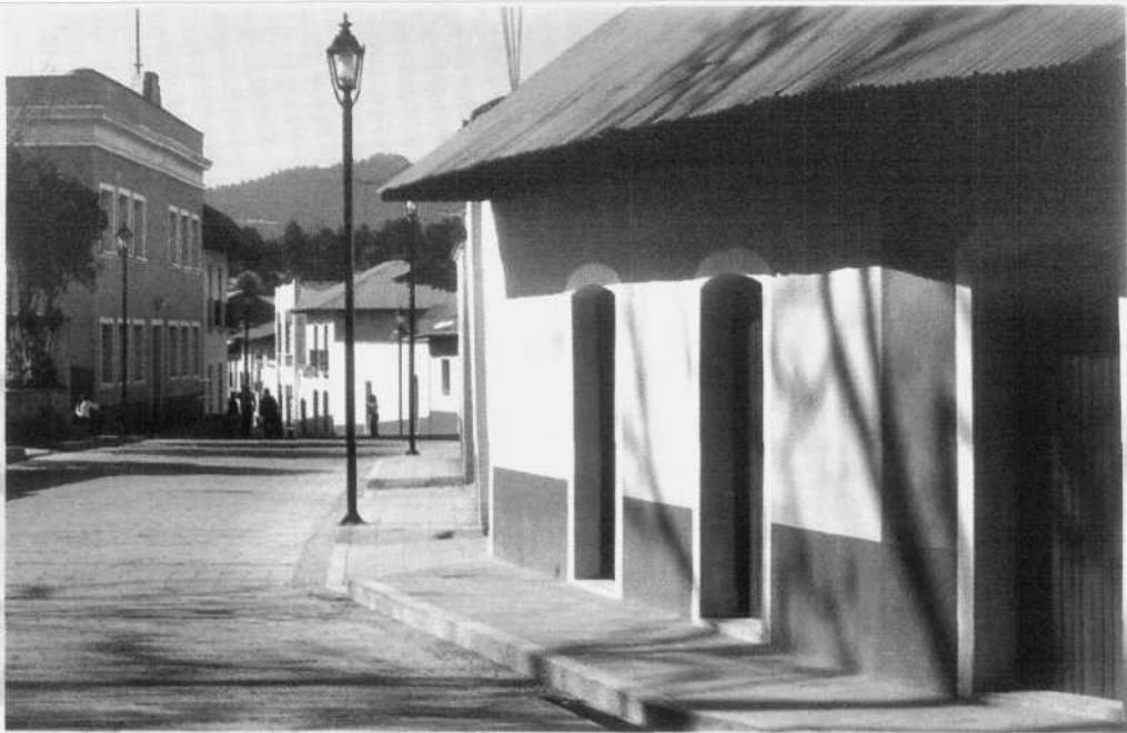
Real del Monte