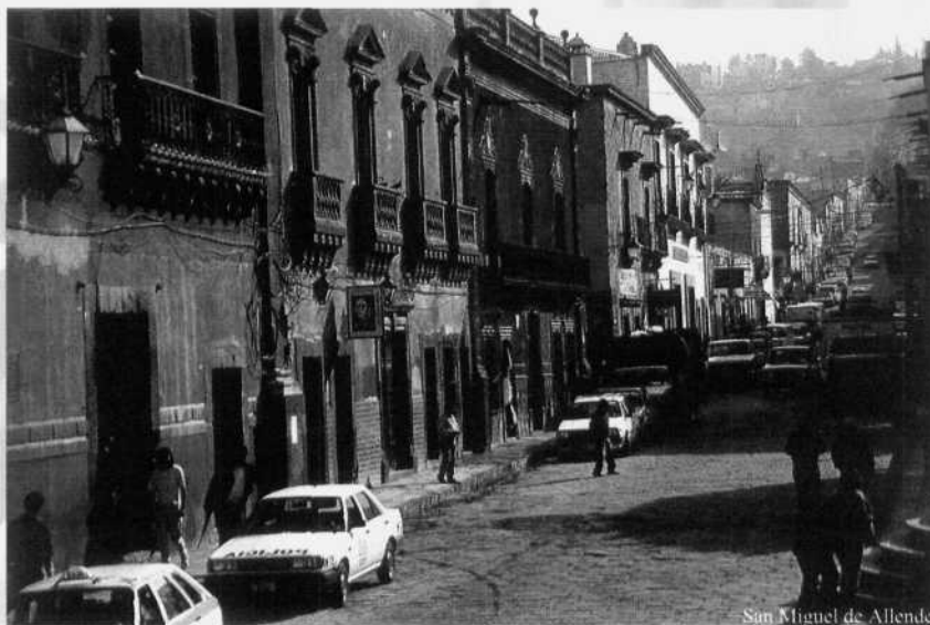
San Miguel de Allende