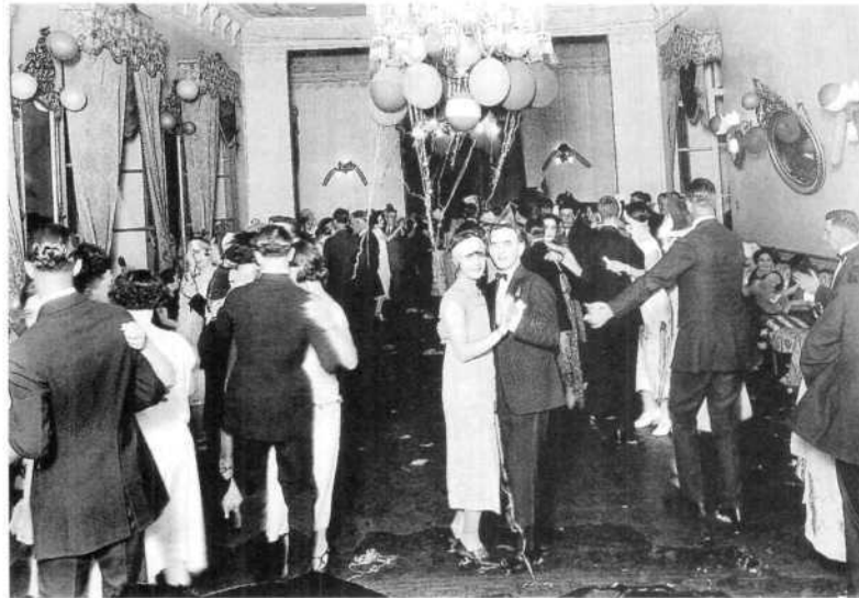
La Lonja Mercantil, 1930

Joaquín Santamaría (1890-1970). Mexicano, considerado como el fotógrafo por antonomasia de Veracruz. Durante poco más de medio siglo (1920-1975) fue un cronista de excepción del Puerto a través de las imágenes de su lente.