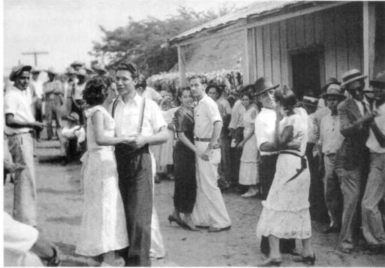
Baile popular, 1932