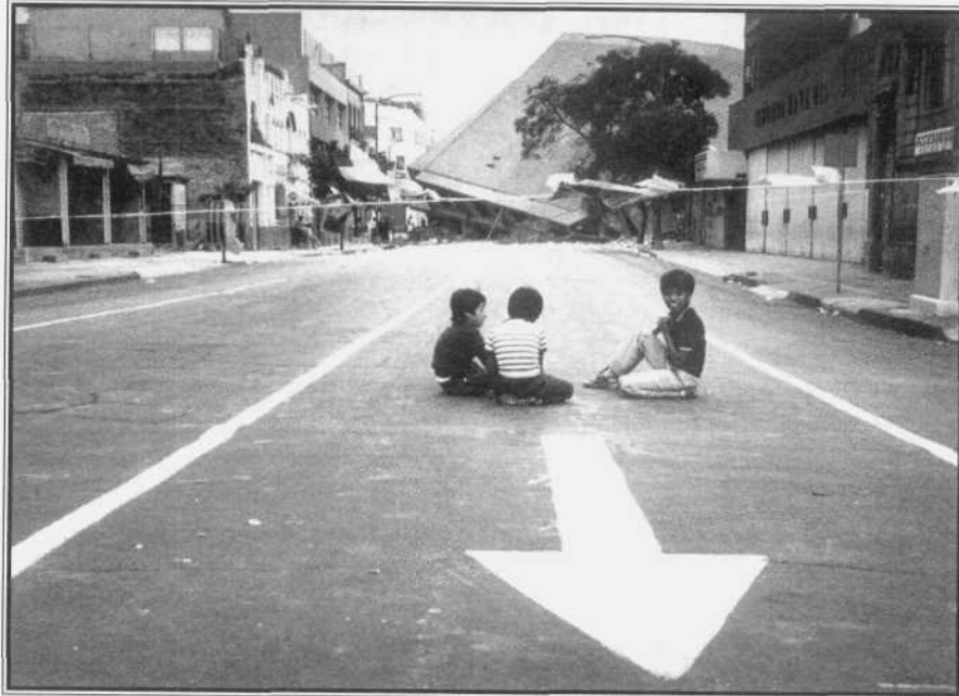
Amores sui et mundi. 19 de septiembre de 1985. Colonia Roma, México D.F. Gelatina de plata al selenio.