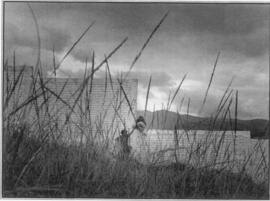
El salto del último sol. Gelatina de plata al selenio, Cuajimalpa, 1983.