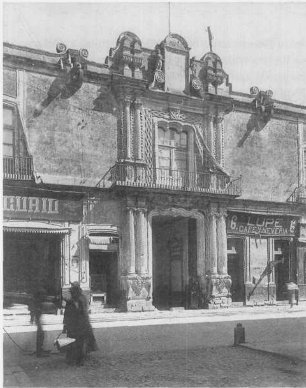
Henry Greenwood Peabody Casa de los Condes de Santiago de Calimaya. Fachada Ciudad de México, 1898