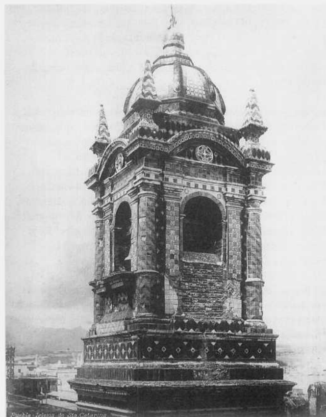
Guillermo Kahlo Iglesia de Santa Catarina, vista del campanario. Puebla, Puebla, 1910 Col. Ricardo Salinas Pliego / Fomento Cultural Grupo Salinas