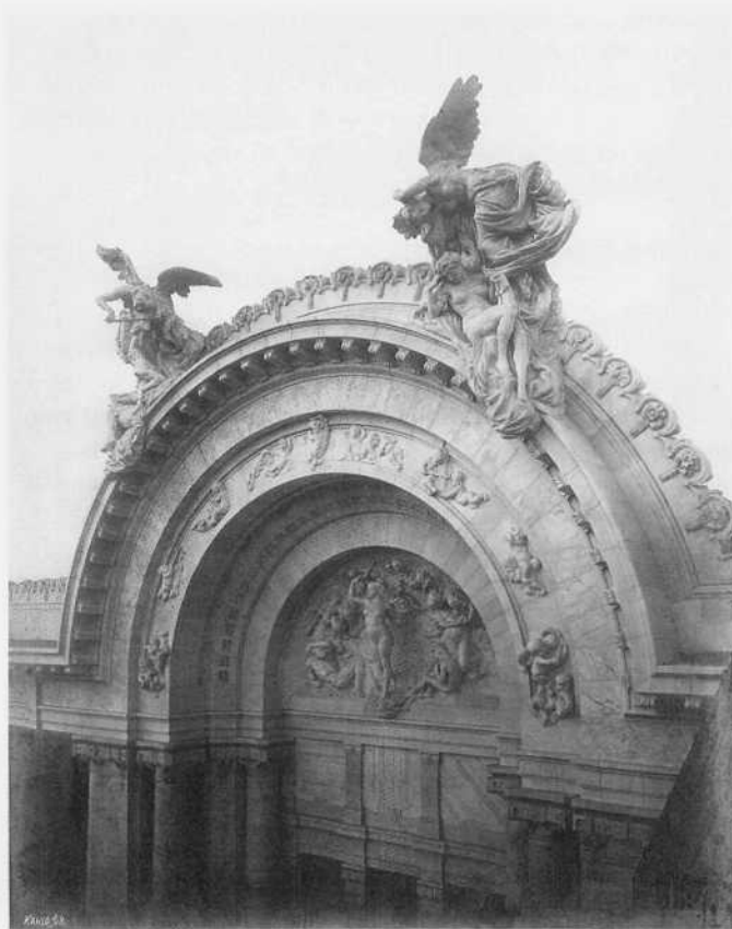
Guillermo Kahlo Cornisa del Teatro Nacional, Palacio de Bellas Artes, detalle del frontón. Ciudad de México, 1911