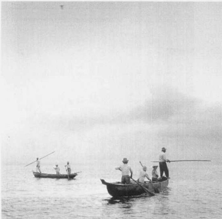
Pesca con arpón. Manta, Manabi, 1949.

Blomberg (Suecia, 1912). Explorador, escritor, cineasta y fotógrafo. Corresponsal de guerra neutral, durante la Segunda Guerra Mundial. Realizó 33 películas documentales para la televisión y lideró expediciones para realizar largometrajes en Ecuador, Indonesia, Australia, Colombia, Brasil y Perú. Su producción incluye 20 libros y cientos de artículos para prestigiosas revistas como Life y National Geographic . Varios de sus libros fueron traducidos al español, inglés, polaco, checo, ruso, danés y noruego. El 75 por ciento de su producción tiene como protagonista al Ecuador, su cultura, su naturaleza y su historia.