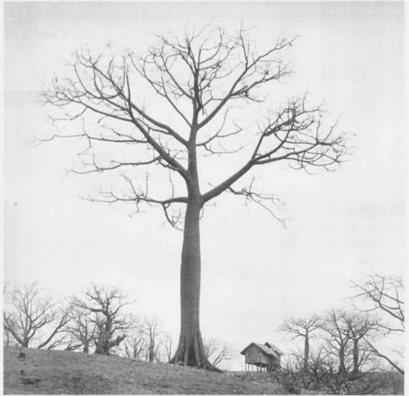
Ceibo gigante. Manabi, 1968.