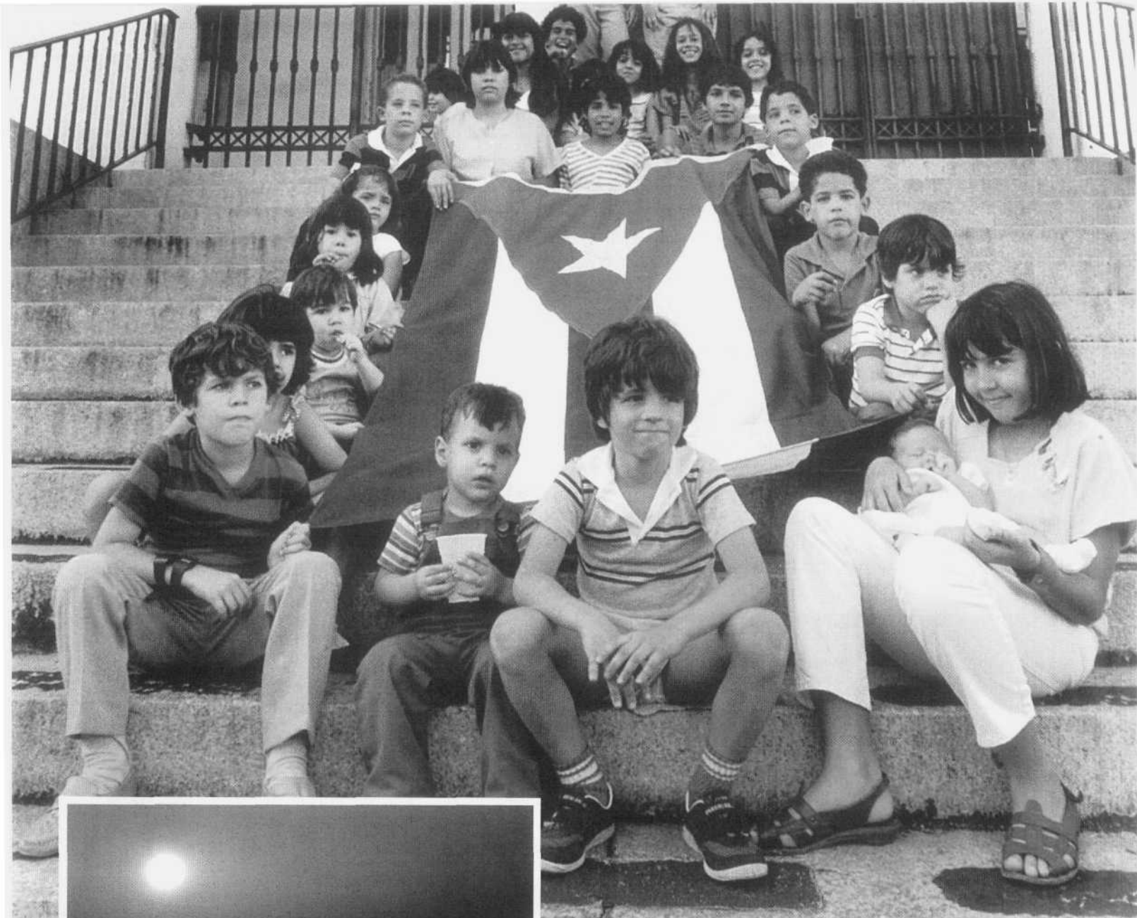
Niños que se identifican con su nación Puerto Rico, del presente y del futuro, 1990.