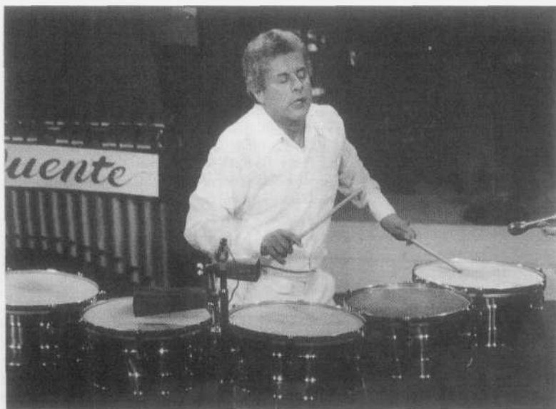
El gran maestro del timbal puertorriqueño Tito Puente demuestra sus dotes musicales, 1990.

Al regreso de su servicio militar, su primer trabajo fotográfico formal lo llevó a cabo para el periódico El Imparcial , donde fue contratado por Pedro Julio Burgos en 1961 con una plaza de fotógrafo, teniendo que cubrir toda la Isla. Después de tener allí una experiencia básica, pasó a trabajar en 1962 con el periódico The San Juan Star , mismo que se había fundado un par de años antes. Es en este periódico que se desarrolló plenamente, según sus palabras, trabajando allí por unos 20 años. Desde que comenzó a colaborar en estos dos medios periodísticos, las agencias de noticias internacionales (Sygma Press, Prensa Asociada y Prensa Unida Internacional), le requirieron colaboraciones fotográficas de los sucesos más relevantes de Puerto Rico y del área del Caribe. Otros medios y publicaciones de Estados Unidos lo contrataron también y le publicaron regularmente, como The New York Times , People Magazine , Selecciones y las revistas Time y Life . Además, diversos medios periodísticos internacionales independientes le publicaron sus fotos sobre una diversidad de sucesos.