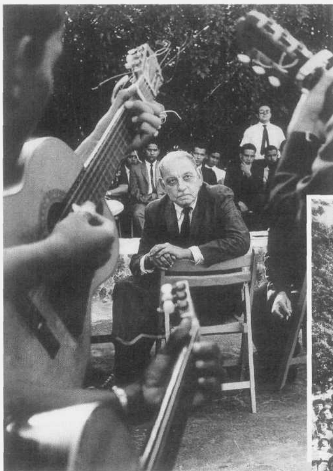
El gobernador de Puerto Rico Luis Muñoz Marín escucha concierto en el patio de su residencia ofrecido por jóvenes guitarristas del conservatorio de Puerto Rico, 1972.