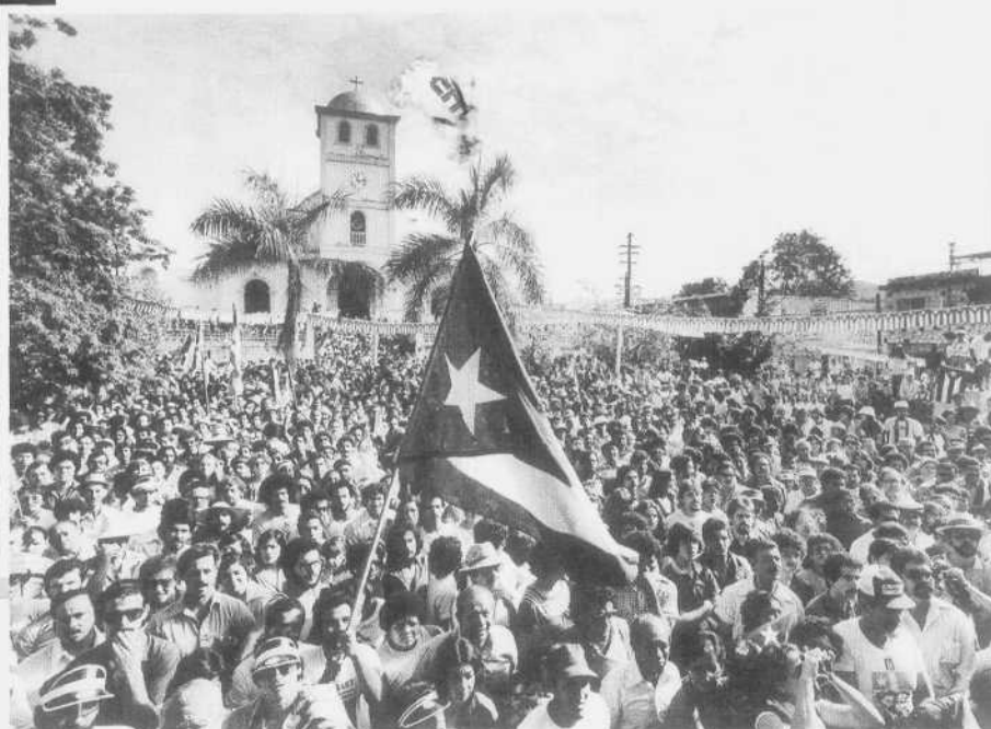
Celebración grito de Lares de 1868, el pueblo patriota apoya gesta cada 23 de septiembre de cada año, 1968, Año del centenario.