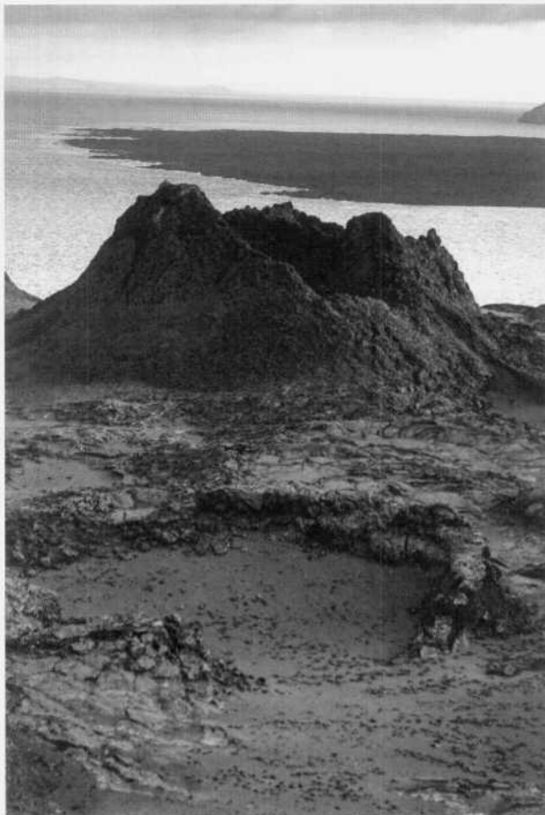
Cráteres Isla Bartolom