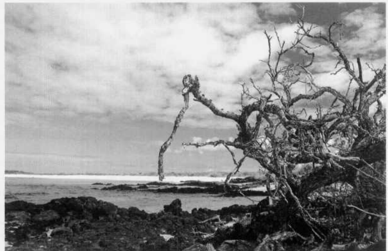
Playa Bachas, Isla Sta. Cruz