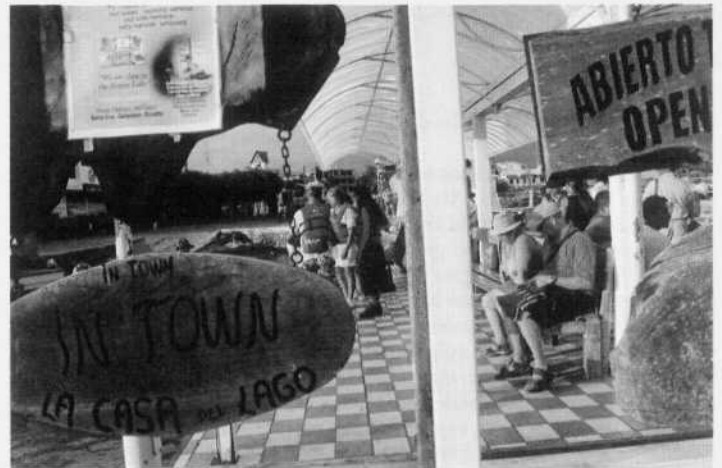
Muelle Pto. Ayora