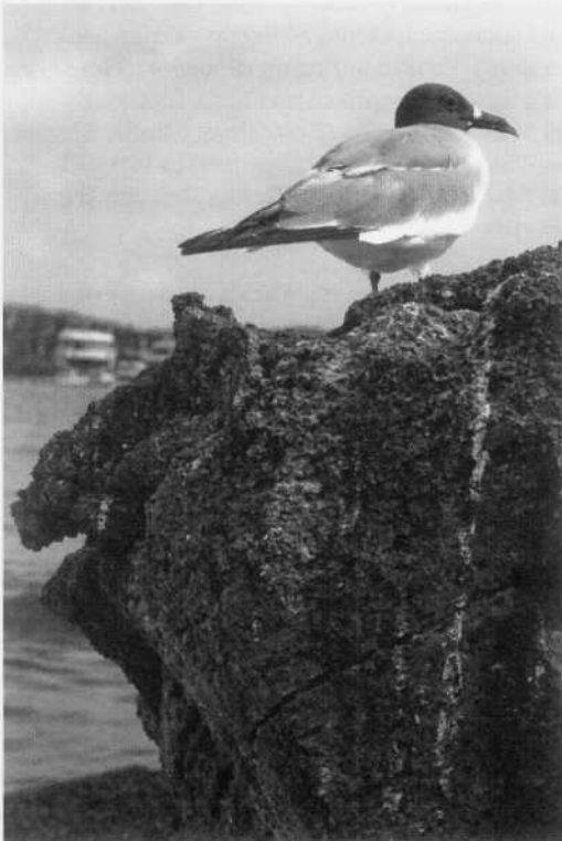
Gaviota nocturna, Isla Genovesa