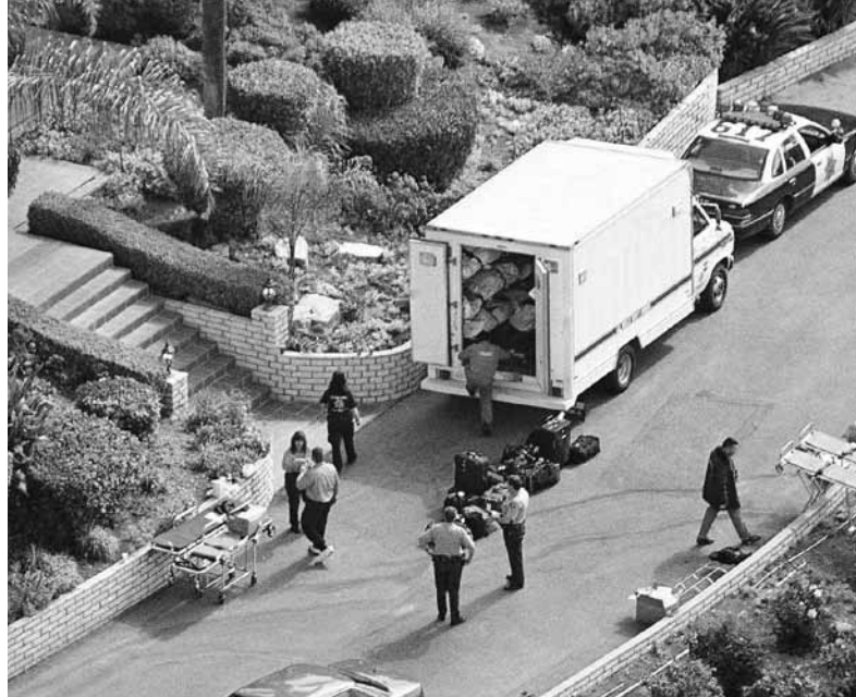
Policías y forenses remueven los cuerpos de 39 miembros del culto La Puerta del Cielo, después de un suicidio masivo ocurrido el 26 de marzo de 1997, en Rancho Santa Fe, California.