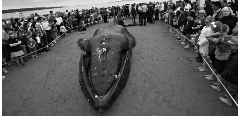
Ballena encallada en la playa