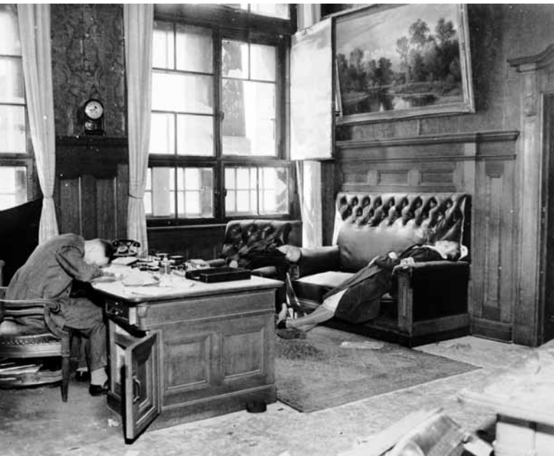
El alcalde de Leipzig y su familia, quienes se suicidaron una vez que las fuerzas aliadas tomaron Berlín durante la Segunda Guerra Mundial.