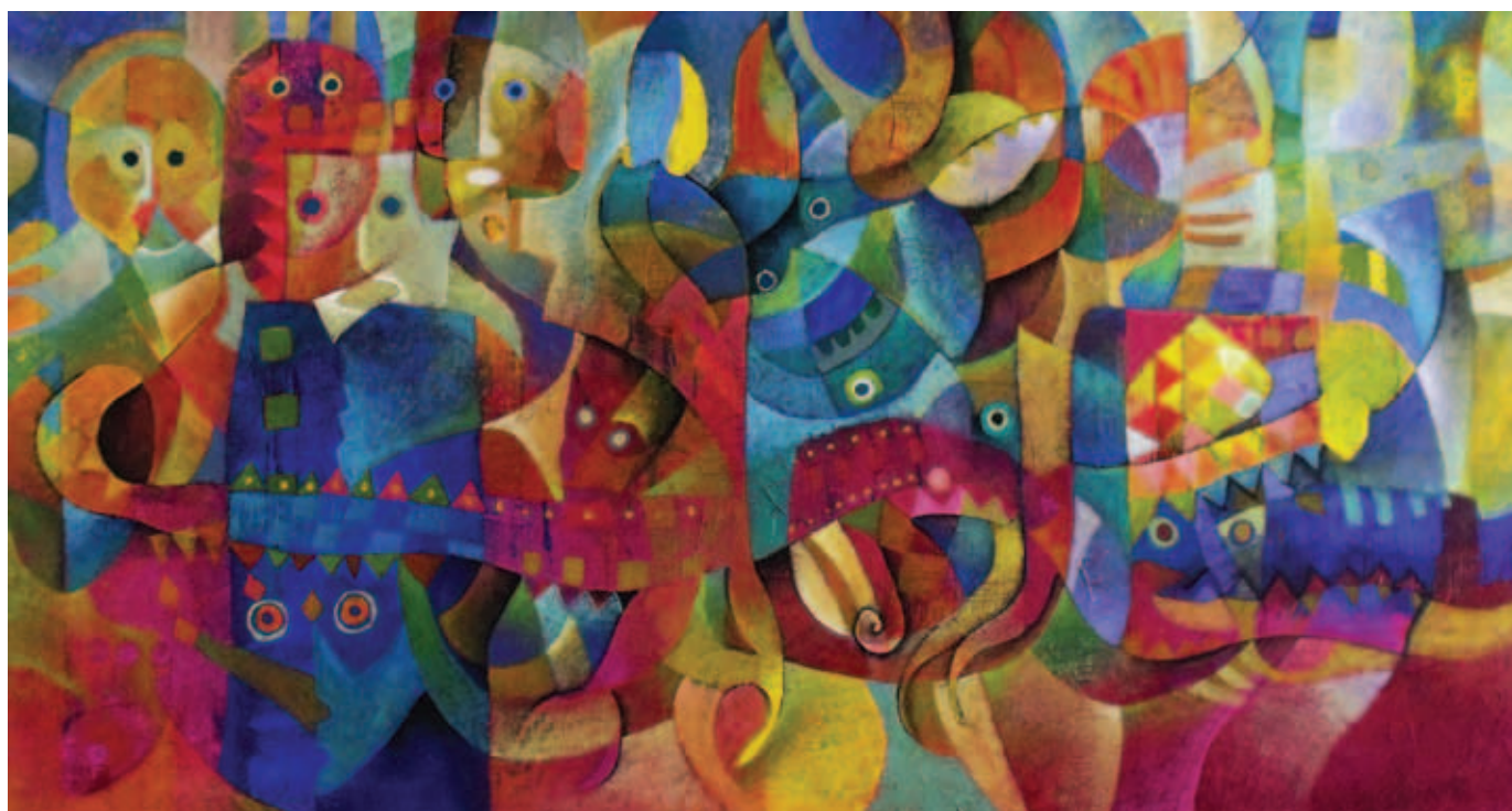
El dragón volvió a casa. Acrílico