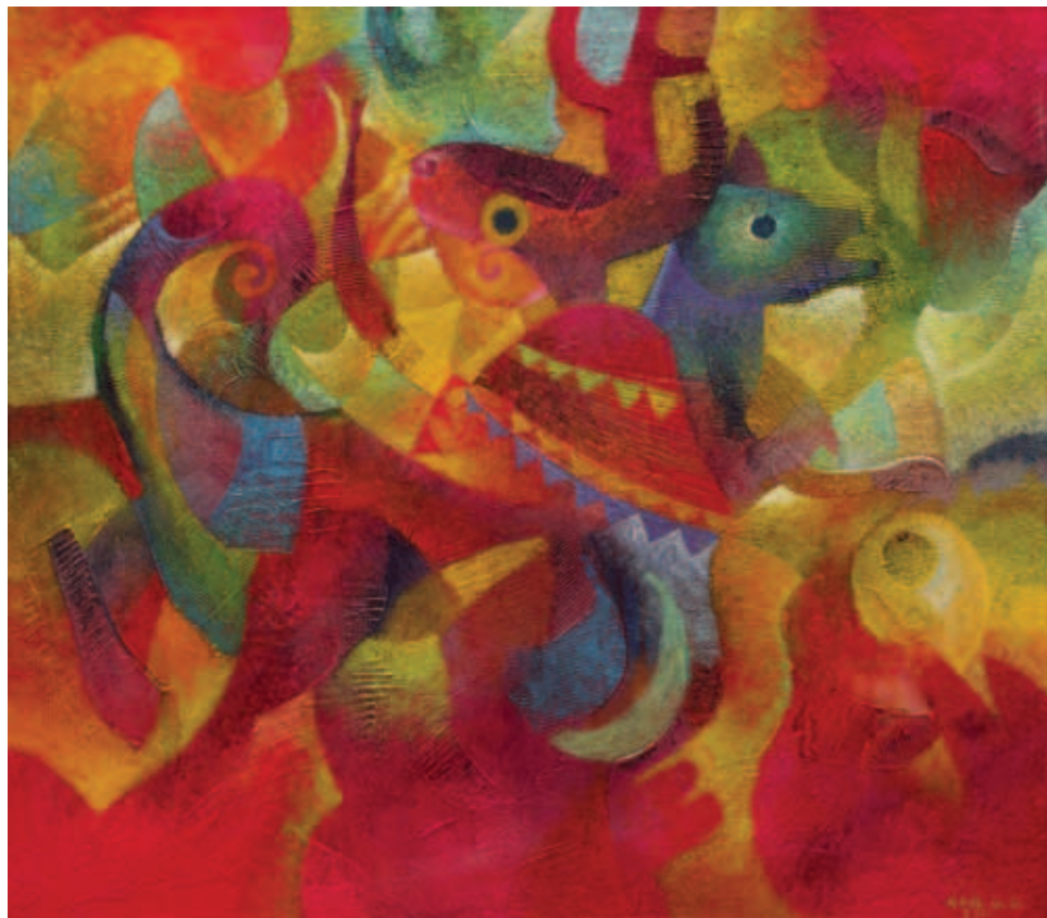
El sueño del perro azul. Acrílico