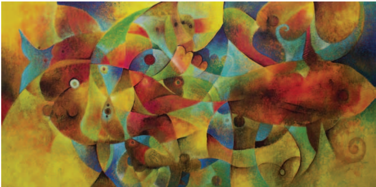
Apocalipsis de los animales. Acrílico