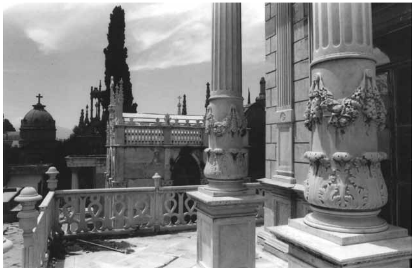
Panteón de la Piedad

Lourdes Pérez de Ovando. Fotógrafa mexicana. Estudió Artes Plásticas en la Escuela Nacional de Pintura y Escultura (La Esmeralda) y fotografía en el CUEC de la UNAM y en la UDLA. Su trabajo está enfocado a la fotografía del Patrimonio Arquitectónico, colaborando así a su difusión y a la concientización de su importancia en nuestra identidad y nuestra historia.