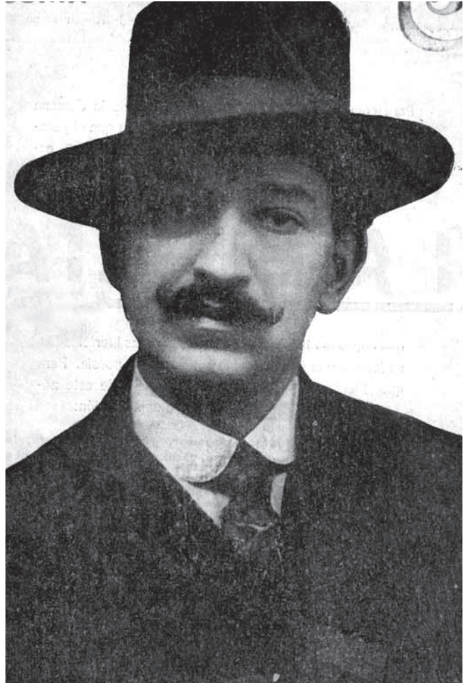
Enrique Gómez Carrillo

el guatemalteco escribió un libro titulado: El misterio de la vida y la muerte de Mata Hari (el nombre verdadero de la famosa bailarina era Margarita van Zelle, que había despertado la admiración y aceptación del mundo artístico francés). En el libro el escritor guatemalteco niega la traición, en especial porque no pudo comprobarse que la famosa artista hubiese tenido contacto con los militares alemanes hospedados en un hotel parisino, donde ella acudió por casualidad. Las crónicas de Gómez Carrillo se sujetaron a las exigencias de la Bella Época, pero no logró romper la barrera del siglo xx, pese a que se hizo rico por sus derechos de autor. Cayó en la frivolidad propia de la Europa de los años 20, de las conversaciones de café, del ajenjo y búsqueda de mundos artificiales, aunque también ofreció luminarias en sus crónicas. Fue un personaje mimado, todos los grandes europeos de la época querían reseñas escritas por él.