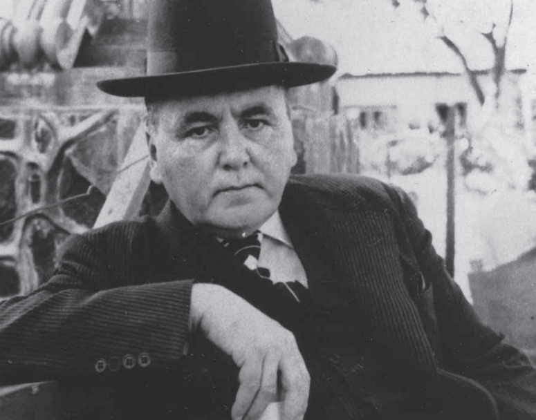
Joaquín García Monge

Gallegos, Luis Cardoza y Aragón, Claudia Lars, José Carlos Mariátegui, Salarrué, Salomón de la Selva, con quienes se formó una red de escritores que apoyarían la publicación con un tiraje de 1300 ejemplares. Se incluye también a escritores que serán los clásicos de Costa Rica: Carlos Luis Fallas, Max Jiménez, Julián Marchena, Eunice Odio, Moisés Vincenzi, Carmen Lyra. En los años 20, en otros países latinoamericanos un núcleo de escritores publicaba sus trabajos para la interacción de las artes continentales, incluyendo a Estados Unidos, lo que inspira a fundar una fraternidad espiritual con diálogo internacional formulador de una conciencia de Nación múltiple. Las revistas dejaban el testimonio del proceso intelectual por medio de un gran número de materiales que coexistían en publicaciones periódicas. En esa red estaban Babel , de Argentina; Amauta de Perú, con un reconocido director: José Carlos Mariátegui; y Avance de Cuba. Todas con proyecciones de un periodismo literario que consolidaban los sueños de intercambio de culturas como medio de identidad continental.