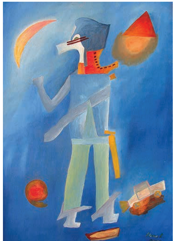
El rufián , 2003. Óleo sobre tela, 100 x 70 cm