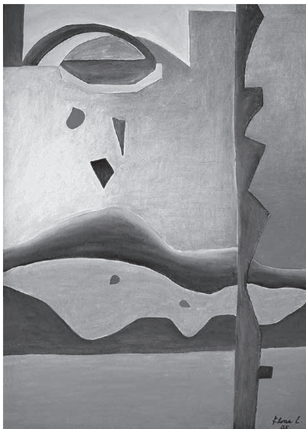
Amanecer , 2005. Óleo sobre tela, 100 x 70 cm