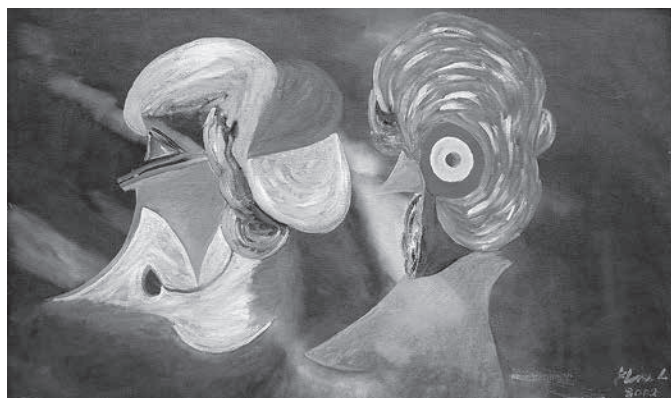
Aristocracia , 2002. Óleo sobre tela, 60 x 100 cm