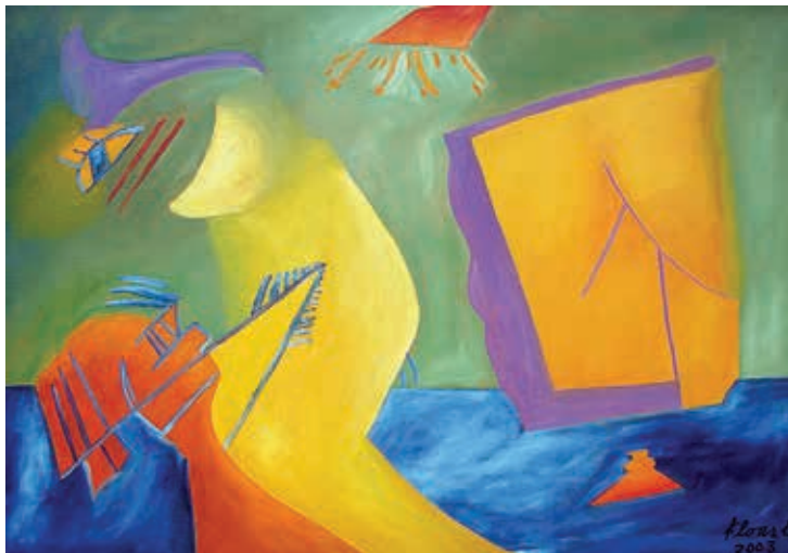
El espejo , 2003. Óleo sobre tela, 70 x 100 cm