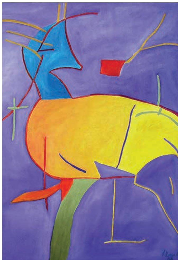
La divina garza , 2008. Óleo sobre tela, 100 x 70 cm