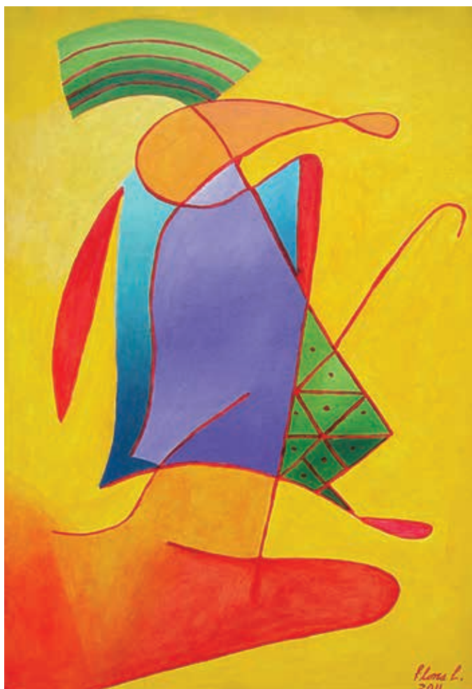
Escondida , 2011. Óleo sobre tela, 100 x 70 cm