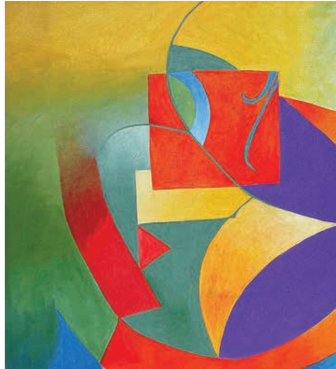
Sueño , 2012. Óleo sobre tela, 70 x 100 cm