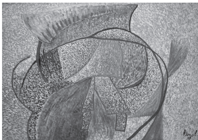
Confusión , 2009. Óleo sobre tela, 70 x 100 cm