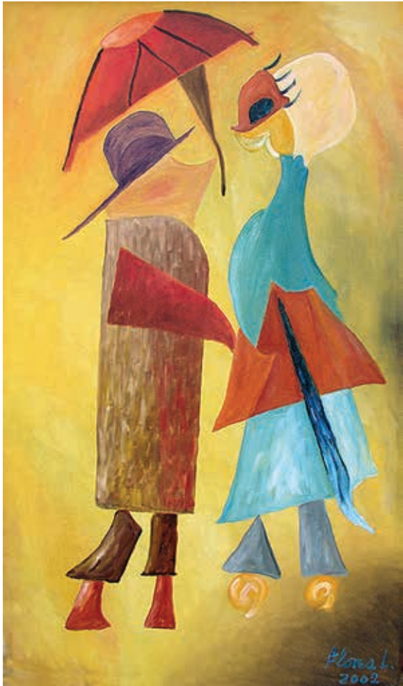
Juntos contra el mundo , 2002. Óleo sobre tela, 100 x 60 cm