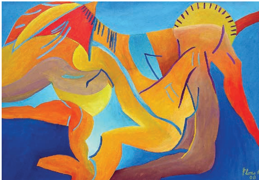
Locura de amor , 2008. Óleo sobre tela, 70 x 100 cm