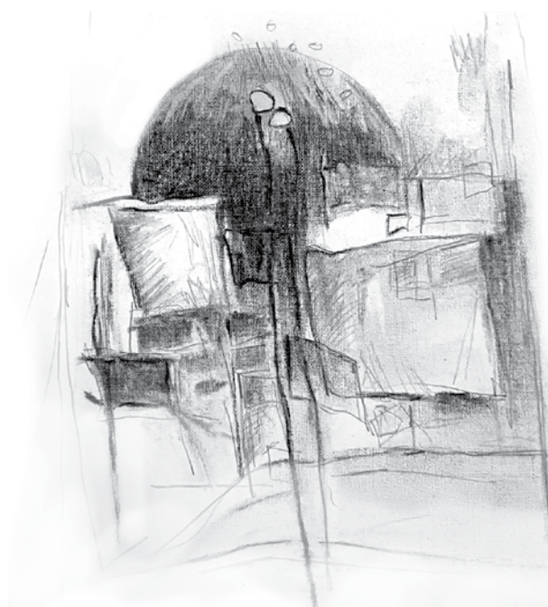
La ciudad del poeta

Cansancio de barro viejo suelo llovido sobre el paisaje triste desvisto el tiempo Tu recuerdo escrito en cada verso un frágil cielo tu mirada Atardecer que oscurece soledad antigua sin ganas de llorar abraza mis pedazos