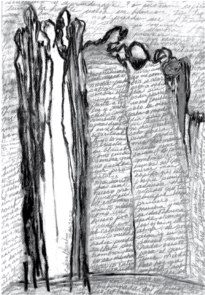
Canto de sirena