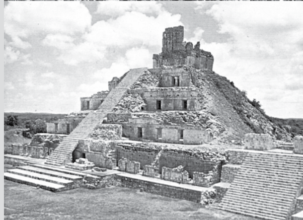
Arquitectura maya de Kabáh, Yucatán; y Edzná, Campeche