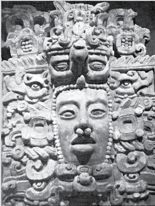
Detalle del mascarón central de una fachada de estuco policromado, proveniente de la zona sur de la península de Yucatán, en los linderos de Campeche y Quintana Roo