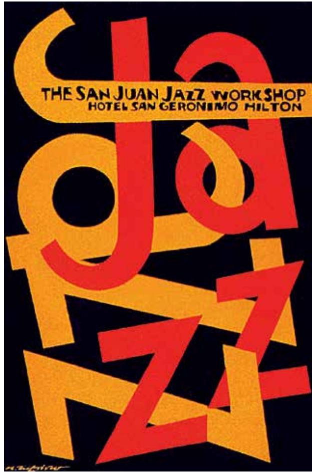
San Juan Jazz