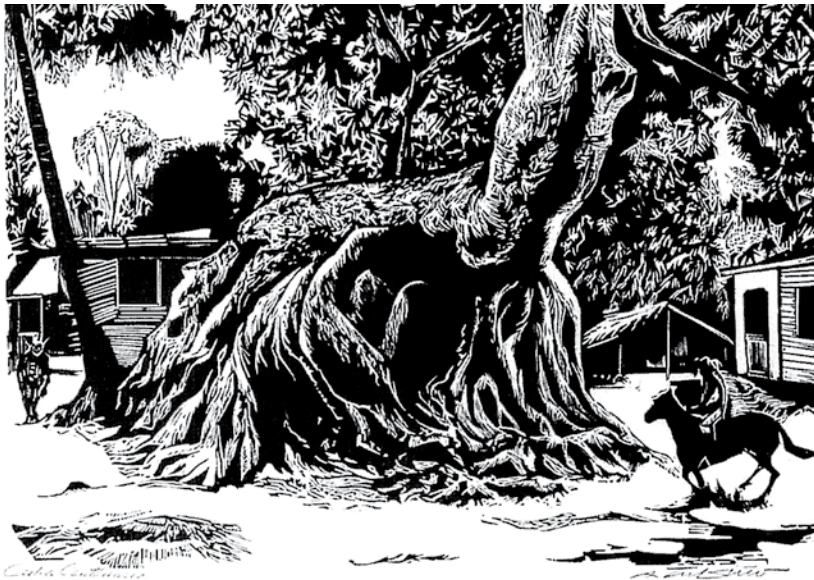
La ceiba centenaria

División de Educación de la Comunidad (DIVEDCO) en 1949, para un mejor desarrollo del pueblo campesino que necesitaba entrar en la modernidad del país y del mundo. Una segunda institución que promovió y desarrolló el gobierno por medio de una ley fue el Instituto de Cultura Puertorriqueña, creado en 1955. En él trabajó Rafael Tufiño junto a otro destacado artista gráfico, Lorenzo Homar, y otros tantos artistas que ayudaron a definir un arte auténticamente boricua, que hoy en día se disfruta con los carteles serigráficos que comenzaron a diseñarse en la División de Educación de la Comunidad para el pueblo, así como en la promoción de las diferentes expresiones que tuvieran que ver con actividades culturales, como exposiciones de niños, jóvenes y artistas destacados que participarían en los diferentes pueblos de la Isla y en el extranjero, donde se les reconocería con grandes premios por su arte de excelencia.