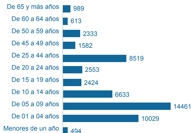
Figura 2. Casos de parotiditis infecciosa por grupos de edad, México 2008-2017