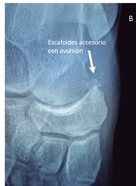
Figura 1. En A: Radiografía antero-posterior de tobillo derecho que muestra un Os subfibulare . En B: radiografía postero-anterior de pie derecho mostrando escafoides accesorio ( Os tibiale externum ) con avulsión, en femenino de 24 años.