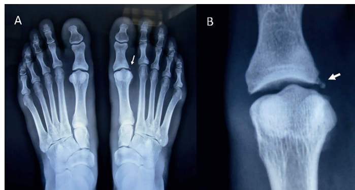
Figura 1. Radiografía simple de ambos pies con apoyo. Se muestra en A: avulsión de la inserción distal del ligamento colateral externo (flecha) de la primera articulación metatarso-falángica; y en B: acercamiento (flecha).

Paciente mujer de 28 años, practicante de triatlón en los dos últimos años, acude por dolor en espacio intermetatarsiano entre primero y segundo, de tres días de evolución, posterior a correr una cuesta prolongada de 7 km. A la exploración dirigida presentó: dolor exquisito en cara lateral externa de base del hallux, incrementándose a la aducción, existiendo bostezo articular externo. La dorsiflexión MTF disminuida a 45°, resto de exploración normal; con diagnóstico de dedo de césped, se piden radiografías simples de ambos pies con apoyo. Se le manejó con zapato con suela en mecedora por cuatro semanas y con analgésicos, dándose de alta asintomática, con indica-