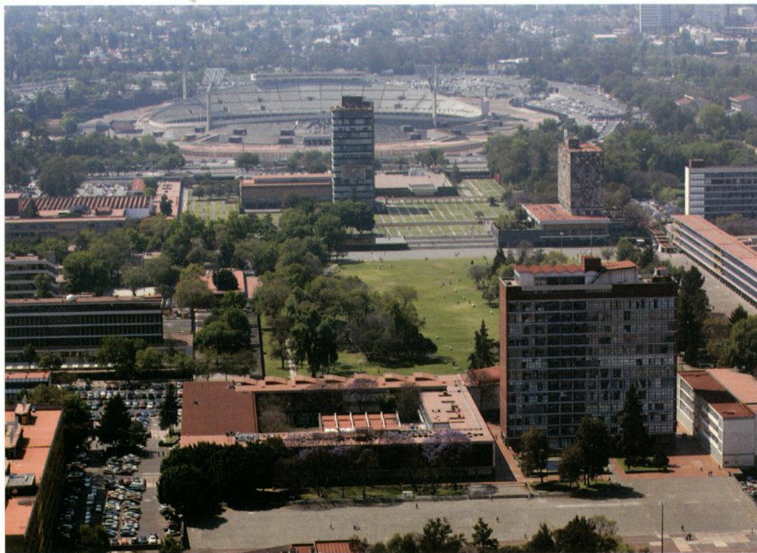
Vista aérea de Ciudad Universitaria (2007)