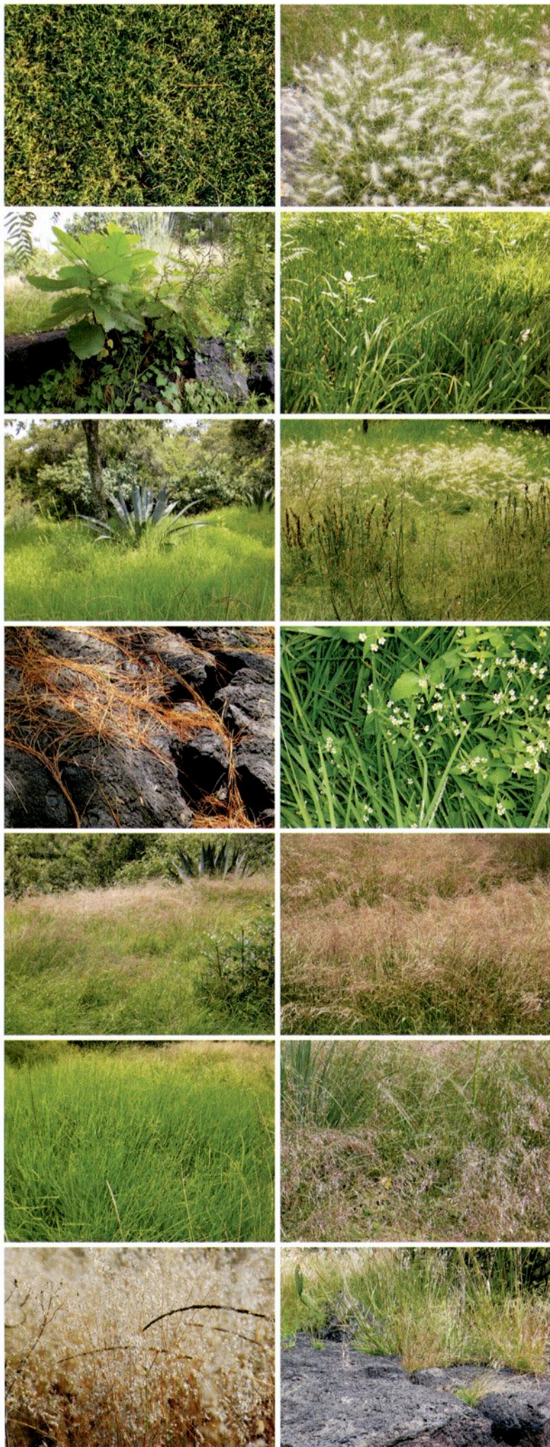
Pasto del campus central (arriba a la izquierda) y aspectos de la reserva ecológica

Existe ya un modelo para tal cambio mental de la planeación verde en las ciudades. En otoño de 2006, el Canadian Centre for Architecture en Montreal 3 expuso la obra del ingeniero ambiental Gilles Clément (junto al arquitecto ambiental Philippe Rahm) con el lema “Medio ambiente: acercamientos al mañana”. 4 Clément exigió a sus colegas paisajistas-arquitectos la reanimación de la