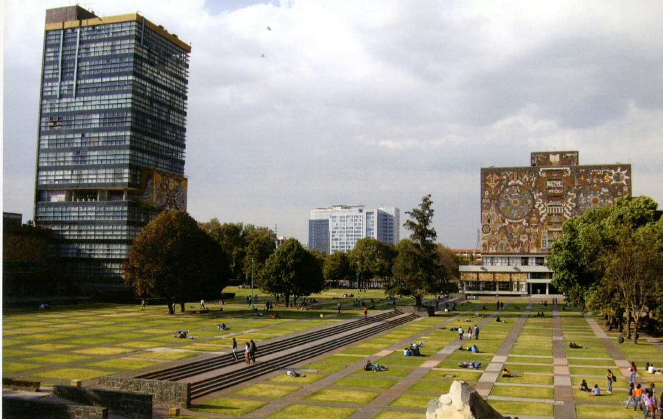
Entre Rectoría y la Biblioteca Central irrumpen el edificio de Conagua y la torre Murano

"sabiduría del jardinero", quien primero observa los paisajes para encontrar en ellos riqueza natural digna de estudiar, la cual proporciona criterios de intervención sutil. Aun los territorios verdes olvidados, o los espacios contaminados por basura revelan principios y características de la relación entre hombre y naturaleza. Posteriormente, todos los datos empíricos sirven como diagrama de valores que indican los puntos clave para la planeación paisajística; es decir: ¿qué tendencias en el desarrollo del microespacio son dignas de impulsarse? Si existen abusos como convertir un espacio verde en basurero, ¿a qué se debe y cómo funcionaría una contraestrategia educativa, lúdica?