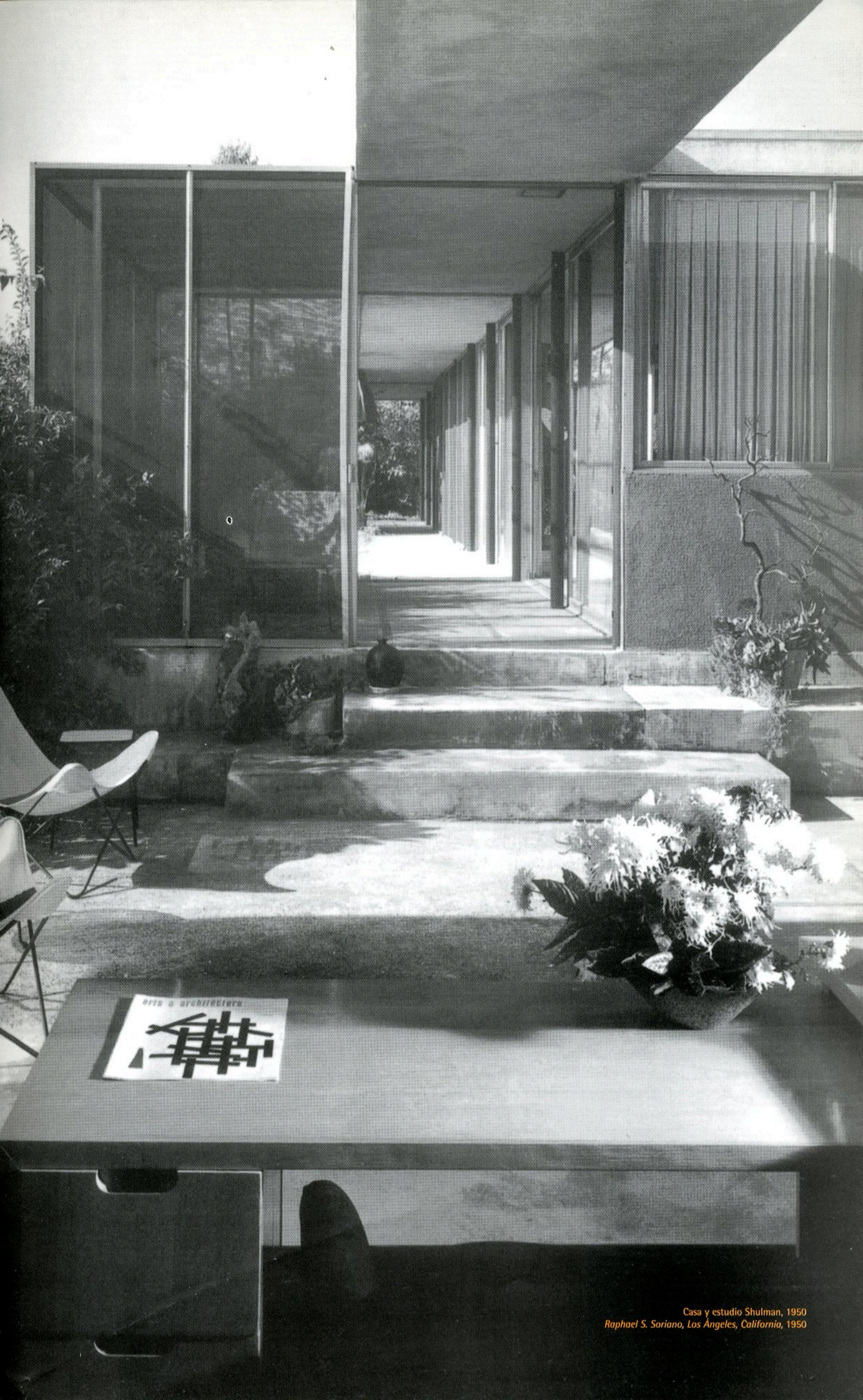
Casa y estudio Shulman, 1950 Raphael S. Soriano, Los Angeles, California, 1950