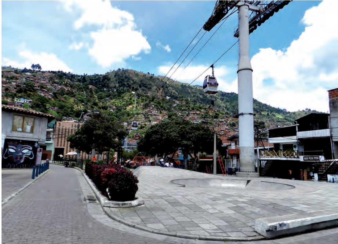
La construcción del sistema de transporte público en Medellín, que incluye teleféricos (metro cable), se vinculó al saneamiento del espacio público precisamente en zonas deprimidas. Esto fue un acierto para mejorar las condiciones de seguridad.