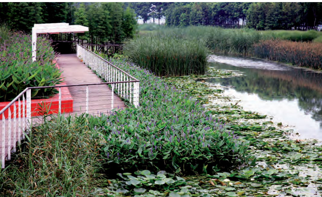
Turescape, Parque Houtan en Shanghái, China, 2010-2015. Un gran humedal de tratamiento de calidad estética sublime, infraestructura verde y parque, aunque desvinculado de la ciudad.

del desarrollo inmobiliario se creó un parque de una extensión de cientos de hectáreas, en la que se organizó una exposición de arte y paisaje.