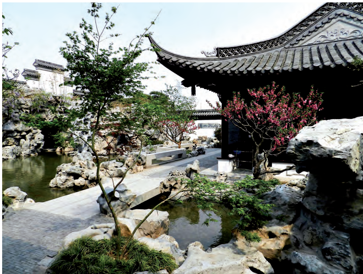
Jardín histórico dentro del Museo de la jardinería china en Beijing. Los jardines son réplicas de obras históricas en diversas regiones de China.

Dejo de lado aquí la discusión sobre el modelo de desarrollo urbano chino y sus implicaciones para dicho país y para el mundo. Por su parte, se observan tres grandes vertientes en lo referente a la profesión en este país. La más evidente consiste en la "ornamental representativa", que se advierte sobre todas las calles principales de las ciudades chinas, en los alrededores de los aeropuertos, en los centros modernos de las grandes ciudades, en las exposiciones de jardinería, etcétera. Aquí, las intervenciones de arquitectura de paisaje afirman contundentemente el poder económico de la potencia China: aspectos de sustentabilidad son secundarios, incluso irrelevantes; al contrario, las áreas verdes requieren de alto mantenimiento y muchas veces domina el "kitsch".