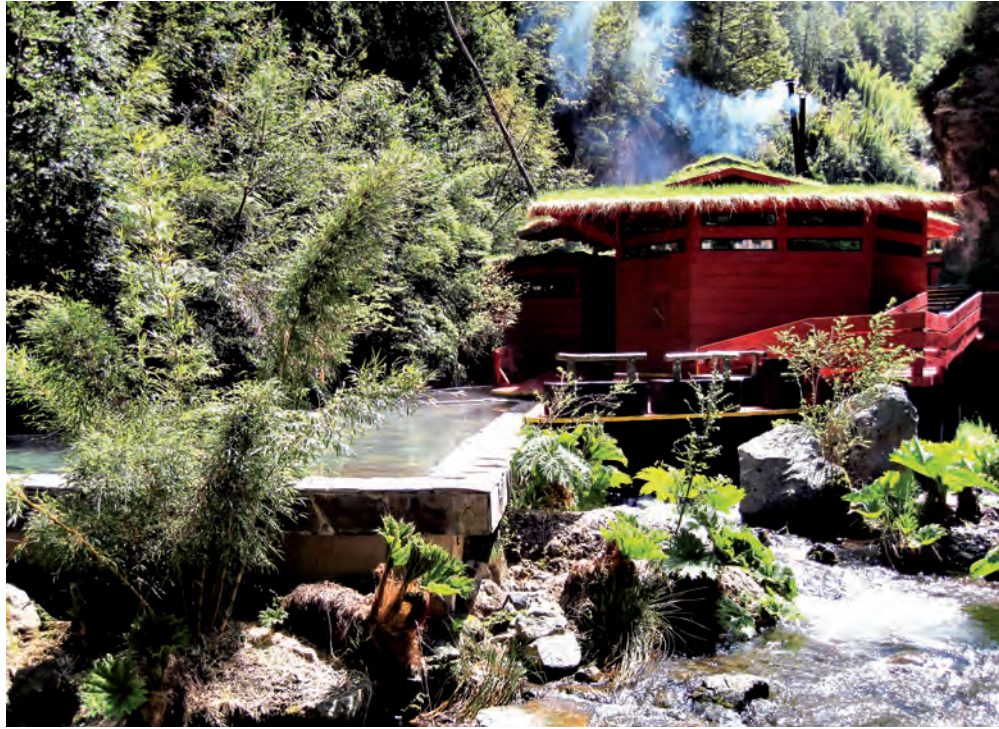
Germán del Sol, Termas geométricas, parque nacional Villarrica, Chile, 2009 Resalta la sencillez de los elementos que componen la intervención: los andadores, las cabinas y las albercas rectangulares

la propuesta de rescate del Río Grande y Río Chiquito de Morelia de TAU Arquitectura y Urbanismo, y Paisaje Radical (2010). Cabe mencionar que la Comisión Nacional del Agua y Protección Civil aún no han podido comprender las soluciones que la profesión puede aportar para la problemática del agua en México.