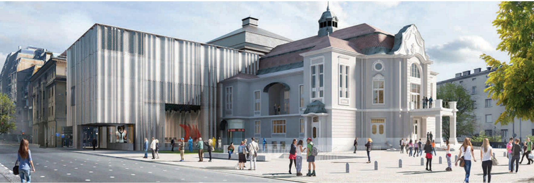
Perspectiva de la propuesta de renovación y ampliación del Teatro Nacional de Eslovenia, Bevk Perovič arhitekti, Ljubljana, 2017. Urban Petranovič y Mitja Usenik.

Finalmente, en lo que se refiere a la representación arquitectónica, para muchos arquitectos el avance de los renders y las sofisticadas imágenes producidas por los programas de modelado digital han puesto en jaque el rol del dibujo a mano y las representaciones bidimensionales como herramientas de exploración y propuesta proyectual. Más aún, algunos han llegado a preguntarse si “el efecto actual de las computadoras en el dibujo de arquitectura será tan importante como el de la introducción del papel,” 19 o bien sí, con el avance de las técnicas digitales, “¿ha muerto el dibujo?” 20 En esta línea, ciertos profesionales han encontrado, en la recuperación de la estética naif, en los colores suaves y en la simplificación gráfica, la posibilidad de diferenciarse del fotorrealismo característico de las aplicaciones digitales más difundidas. Sin embargo, no es posible desconocer que, como parte de sus estrategias de comunicación didáctica, estas representaciones frecuentemente combinan técnicas análogas con aquéllas ofrecidas por programas de manipulación de imágenes –muchos de ellos de uso gratuito en la nube–, al copiar y pegar partes, agregar filtros, suavizar áreas, entre otros procedimientos híbridos. 21 Esta modalidad puede ser identificada en obras recientes de numerosos estudios jóvenes.