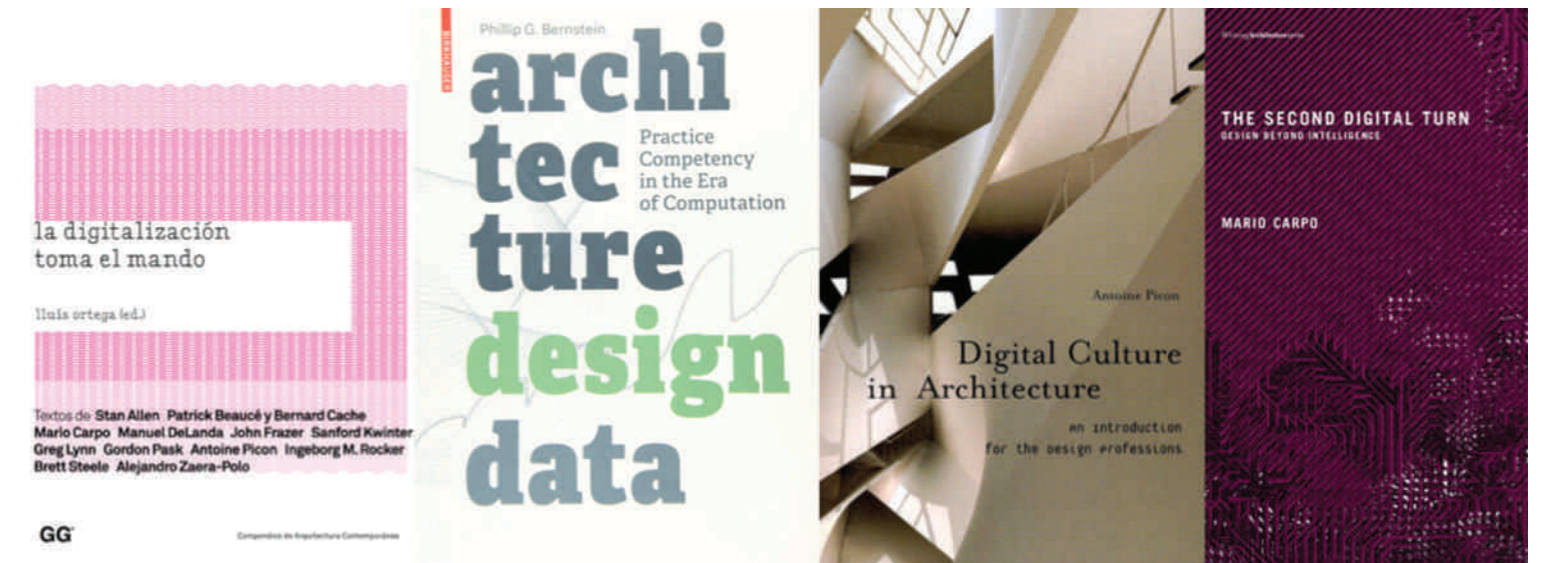
Portadas de algunos textos que constituyen una referencia conceptual sobre la temática

En sintonía con estas ideas, en 1998, un referente de los medios digitales, Nicholas Negroponte, anunciaba, a manera de manifiesto, la superación de lo digital. En su artículo “Beyond digital” 12 asumía que la disponibilidad de estos medios debía darse por sentada. Esta interpretación se generalizó en los debates culturales recién en la segunda década del siglo XXI, cuando se reconoció una progresiva ampliación y naturalización del fenómeno digital a todos los aspectos de la vida cotidiana. Es decir, las que habían sido tecnologías innovadoras de uso eventual para un segmento acotado de la población, ahora formaban parte de las prácticas diarias al trabajar, comunicarse, comprar bienes y servicios, estudiar o realizar actividades recreativas, tal como lo han expuesto diversos trabajos de William J. Mitchell y John Frazer, entre otros. 13