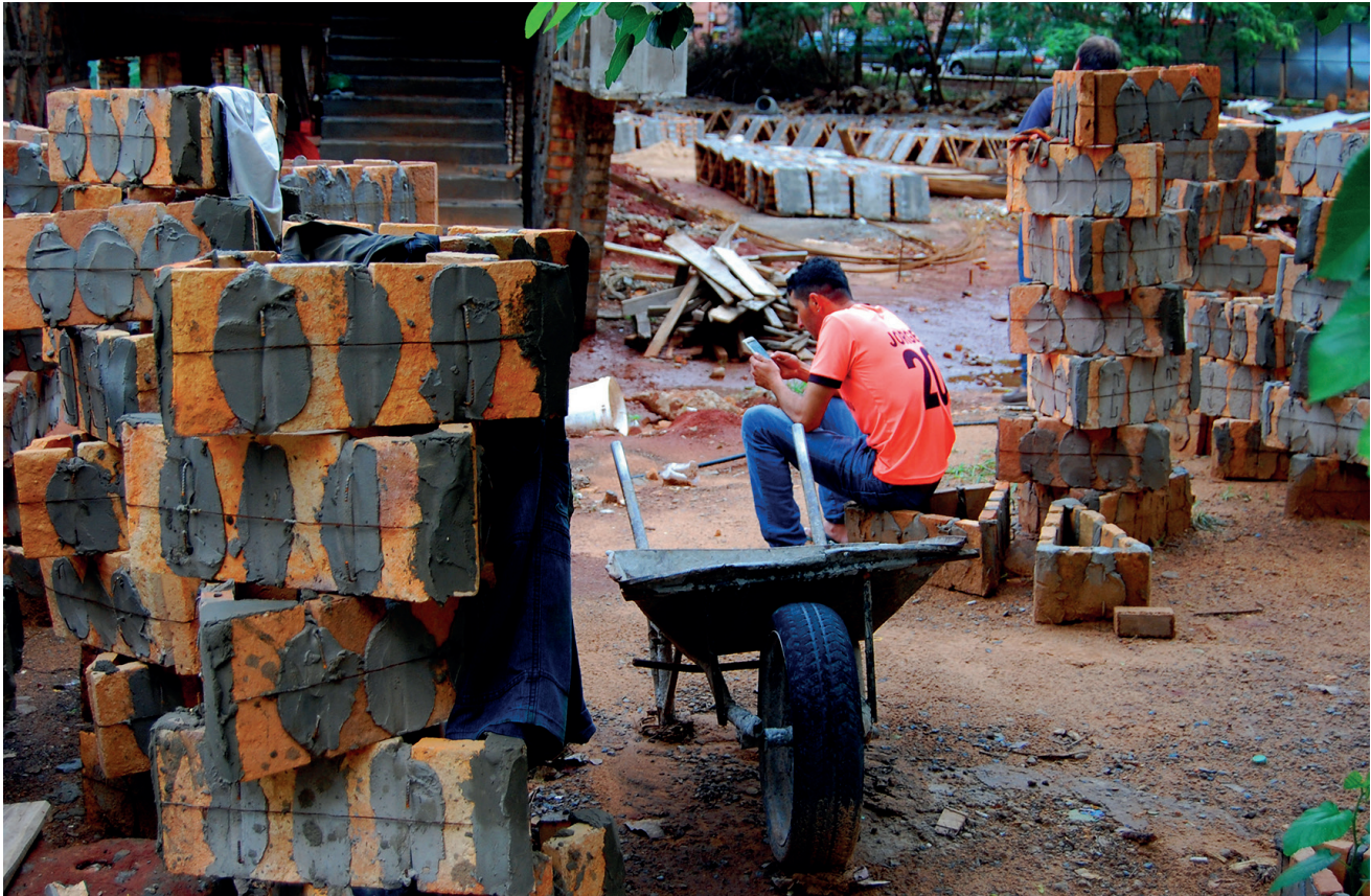
Artesano durante una pausa en el proceso de obra de la Facultad de Arquitectura, Diseño y Arte de la Universidad Nacional de Asunción, diseñado por el Gabinete de Arquitectura.

ción de objetos arquitectónicos singulares que fácilmente quedan en la retina del habitante. Es así como comienza a ser reconocida entre sus habitantes y cada obra aporta a esa identidad local. Este aspecto permite ampliar los aspectos culturales de Paraguay, afrontando la contemporaneidad de los nuevos tiempos.