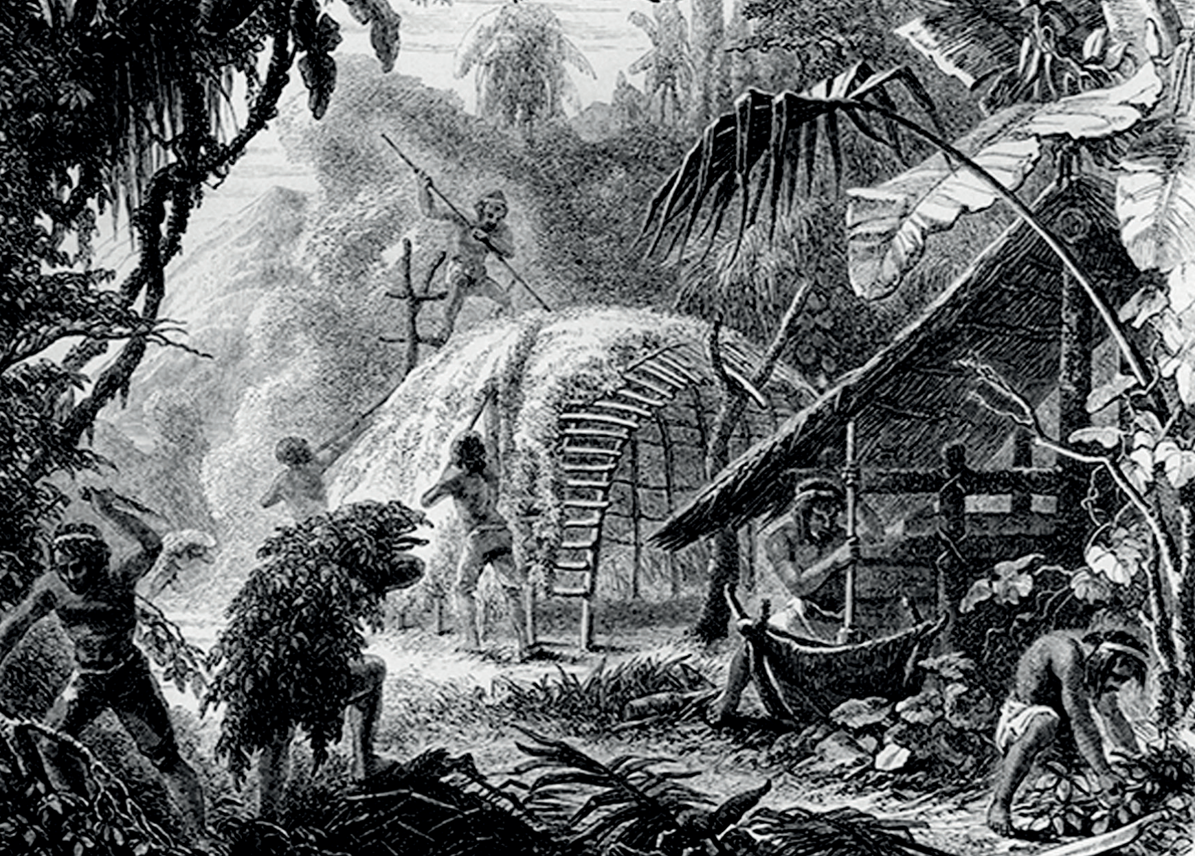
Cosecha del mate en la rívera del Paraná, en el Paraguay. Grabado de Alfred Demersay. Fuente: Milda Rivarola (ed.), Paraguay ilustrado , Asunción, Editorial Servilibro, 2016, p. 244.

tectónico, y es ahí donde es posible reconocer un espesor de significados que forman parte de la cultura local de Paraguay. Así como tal cultura a lo largo de su historia tiende al aislamiento, los elementos que componen sus obras de arquitectura tienden a confluir significados asociados a su cultura local. La singularidad de los elementos arquitectónicos que forman parte de sus obras, está definida por el trabajo manual de sus artesanos. El oficio, la factura y la afición por la buena construcción, son propios de la práctica artesanal de los indígenas guaraní y se traspasa a la arquitectura contemporánea paraguaya.