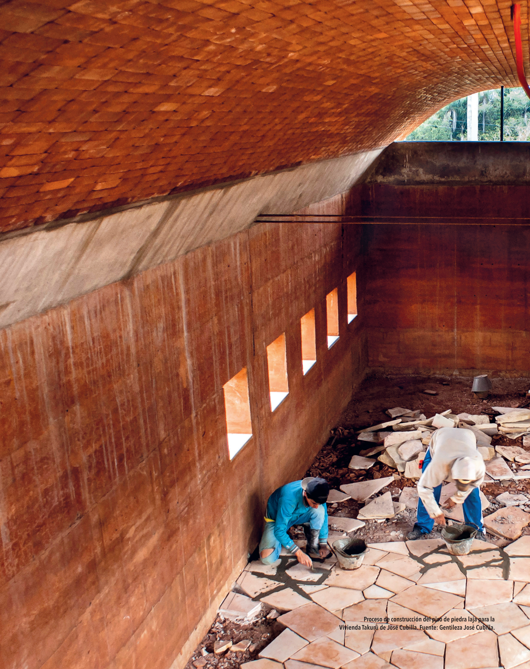
Proceso de construcción del piso de piedra laja para la Vivienda Takurú de José Cubilla.