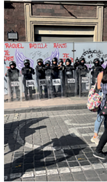
Marcha del 8M (marzo de 2022). Visible la presencia de la policía a lo largo de todo el recorrido de la marcha.

la agenda de la igualdad y las libertades civiles para colocar nuevas cadenas y servidumbres." 9