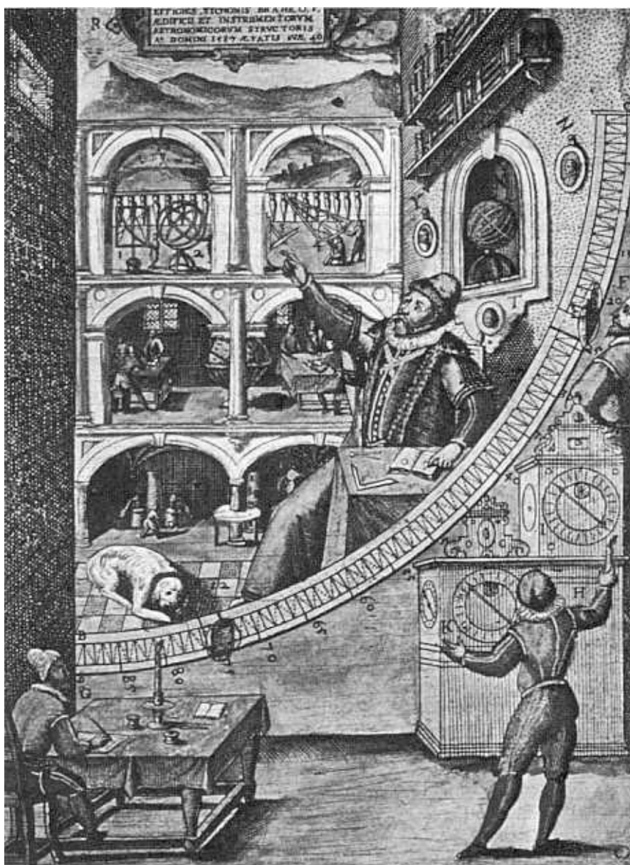
Retrato de Tycho Brahe

En el siglo VI a.n.e., el rapsoda Jenófanes de Colofón, harto de los versos homéricos que recitaba de ciudad en ciudad y que atribuían rasgos antropomórficos a los dioses, propuso a los