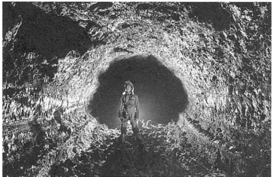
Galería principal. Cueva de la Iglesia. Tepoztlán.

En la zona de absorción el agua tiende a buscar el camino (o sistema de fisuras) que le permita bajar lo más rápidamente posible hasta el nivel de la resurgencia. Se trata de la zona vadosa, en la que predomina la erosión, lo que produce la excavación de galerías en forma de cañón, separadas por cascadas.