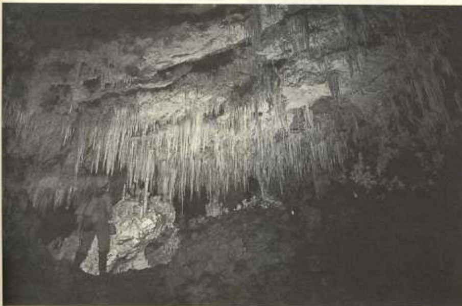
Sierra Negra, Xaltégoxtli, Puebla.

Cuaternario, sucesivamente han inundado y secado estas cavidades; entre los resultados de este fenómeno está el colapsamiento de las partes superficiales del techo de las cavidades, dando origen a los famosos y abundantes cenotes. Con técnicas de buceo, en la costa de Quintana Roo se han explorado algunos cenotes actualmente inundados, encontrándose formaciones estalactíticas y hasta restos arqueológicos, pruebas de que las cavidades estuvieron secas en épocas relativamente recientes. Destaca el Sistema Nohoch-Nah-Chich, que con más de 20 km de longitud es la mayor caverna inundada explorada en el mundo.