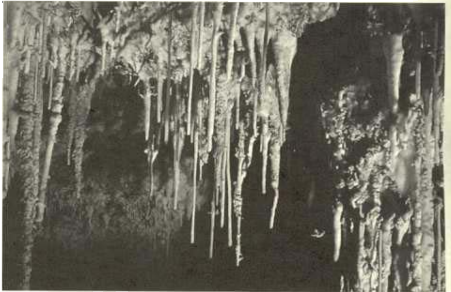
Sierra Negra. Xaltegoxtli, Puebla

Simultáneamente al desarrollo de un sistema de cavernas, la erosión en la superficie también progresa, lo que da por resultado un abatimiento del nivel freático y, en forma paralela, el descubrimiento de nuevos sistemas de fisuras que permiten establecer otro patrón de drenaje, más directo, hacia