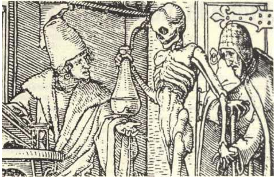
La muerte y el médico, Hans Holbein el joven

Me atrevo a pensar que en este caso la muerte de Michael Furey tuvo sentido, incluso para él, pero ese sentido no estuvo dado por un sacrificio. No por