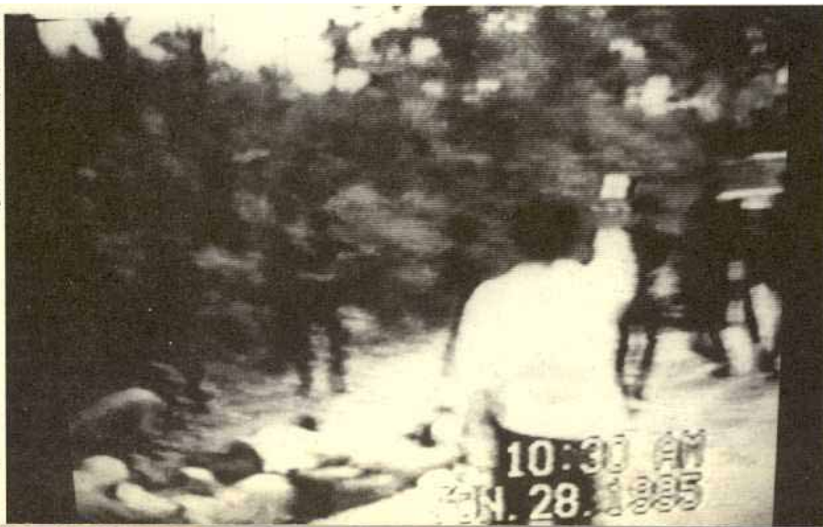
Aguas Blancas, Guerrero, 28 de junio de 1995

mo olvidar?... ¿Cómo olvidar?... ¿Cómo olvidar?... ¿Cómo olvidar