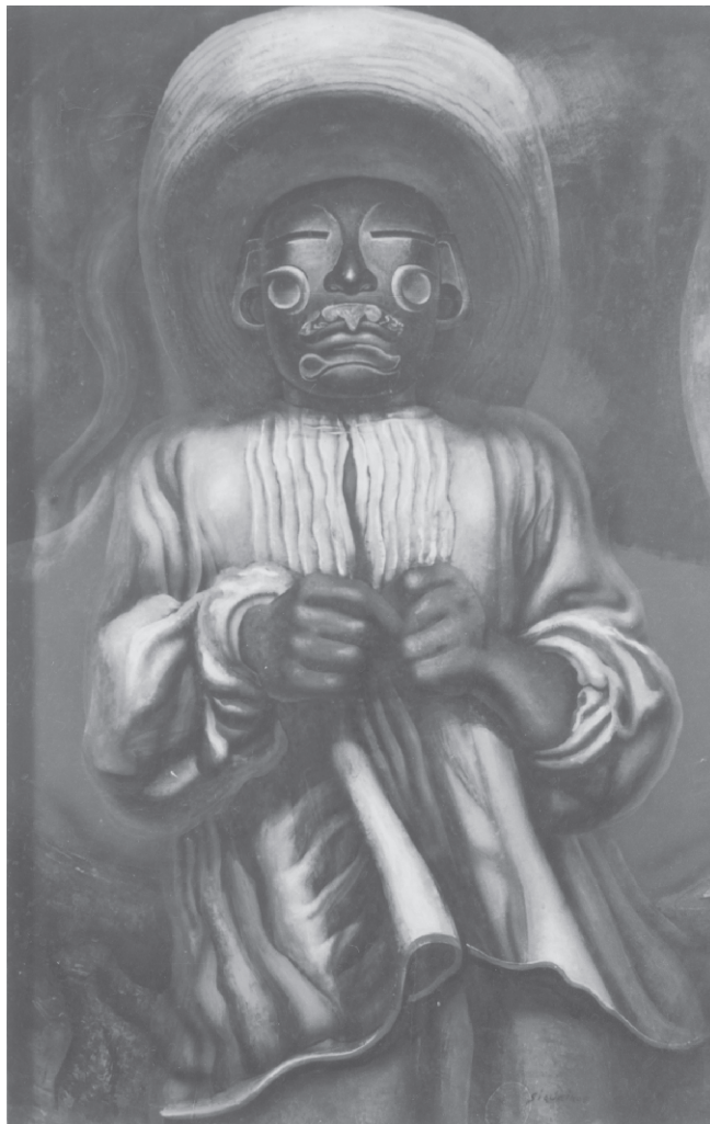
Etnografía , 1939.