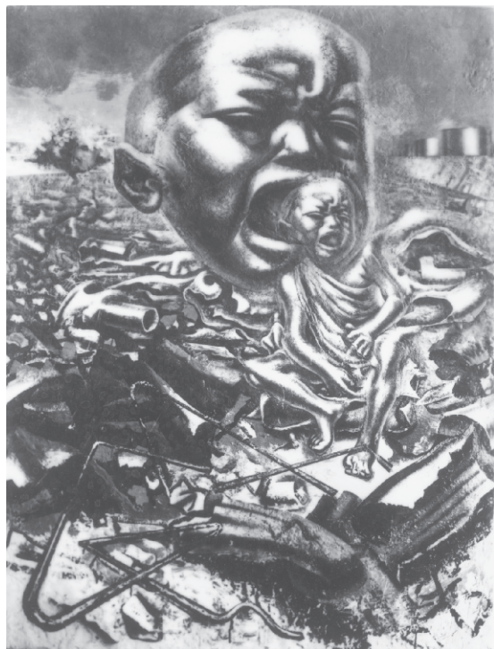
El eco del llanto, 1937.

Siqueiros siempre consideró su obra de caballete como secundaria frente a sus murales. Al salir de la cárcel, retoma el trabajo que había dejado inconcluso en el Castillo de Chapultepec. El hecho de permanecer cuatro años en un espacio reducido, de pintar en condiciones opresivas, con grandes limitaciones y pésimas condiciones de ventilación y de luz, así como la propia situación de encierro, seguramente confirmaron su valoración del movimiento muralista mexi-