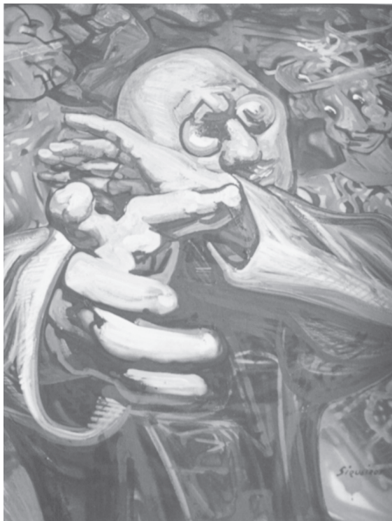
El escapista , 1958.

Obras de caballete de distintas décadas como El sollozo , 1939; El esteta en el drama , 1947; El escapista , 1958; El verdugo , 1962; expresan claramente esta tendencia a lo teatral, a la sensoriedad o el simulacro. Muchos murales manifiestan también esto, ya sea de manera general, en secciones o en personajes específicos dentro de la escena representada, es el caso de la figura del demagogo, del pseudo líder social con rostro de ave y actitudes grandilocuentes y grotescas, que aparece en el mural Retrato de la burguesía , del Sindicato Mexicano de Electricistas, 1939-