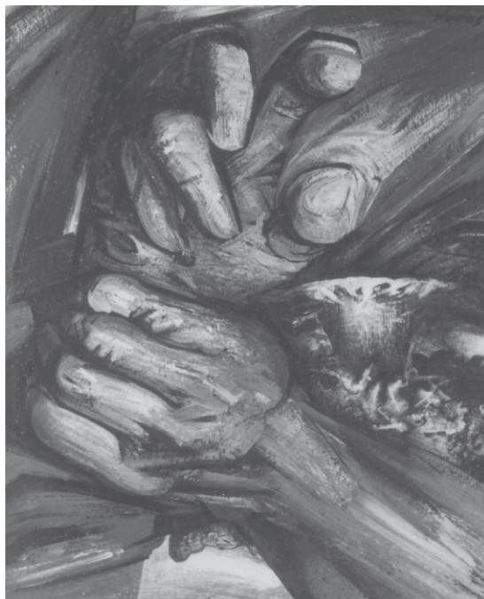
Manos , 1949.

Siqueiros planteó esto desde 1932. Su larga trayectoria como muralista comprendió seis décadas en las cuales se sucedieron gran cantidad de cambios políticos y artísticos, sin embargo, el pintor básicamente mantuvo sus convicciones y procuró aplicarlas hasta sus últimas obras. Evaluar en qué medida lo logró no es tan simple, ya que habría que considerar obras y contextos específicos, lo que sí podemos afirmar es que siempre procuró ser coherente con su posición ideológica, tanto en lo plástico como en lo discursivo (en conferencias o artículos). Considerar la interrelación de las aportaciones teóricas y las artísticas en Siqueiros es funda-