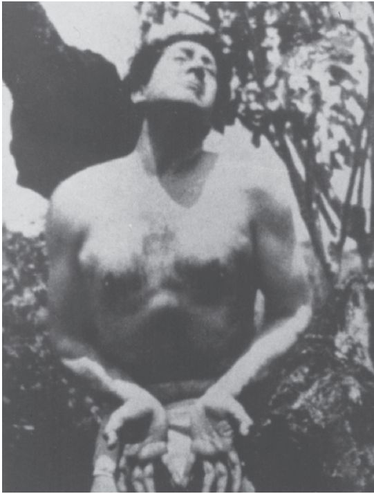
Posando para Nuestra imagen actual, ca. 1945-1947.

Hay obras cuya temática le permite un mayor despliegue de su actitud vital y donde su creatividad se manifiesta con más libertad, son aquellas que recurren a las alegorías y las que presentan una imaginería futurista. Títulos como Monumento al sonido , 1943; Antenas estratosféricas , Ciudades en evolución , ambas de 1949; o Aeronave atómica , de 1956, nos hablan de la preocupación social del pintor vinculada al desarrollo tecnológico, al científico o al urbanismo, entre otras cuestiones.