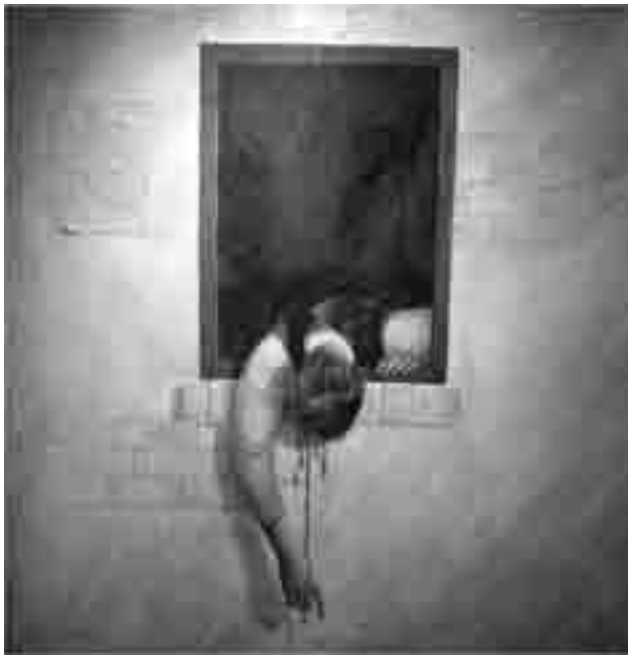
Hossein Khosrojerdi, Mártir , 1980, óleo sobre tela, 150 x 150 cm.

La composición muestra dos diferentes lecturas del Islam. El retrato del joven simboliza la plena vitalidad del Islam, la vida y la esperanza en el movimiento islámico. El retrato del viejo representa la pérdida de la esperanza en el futuro, de la visión retrospectiva de la época, del estancamiento, de la oscuridad.