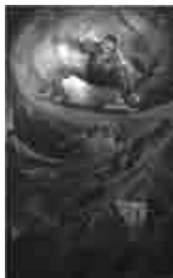
Habib Sadeghi, Cain and Abel's story , oil on canvas, 120 x 200 cm

Is depicted in the paintings, revealing the sacredness embodied therein.