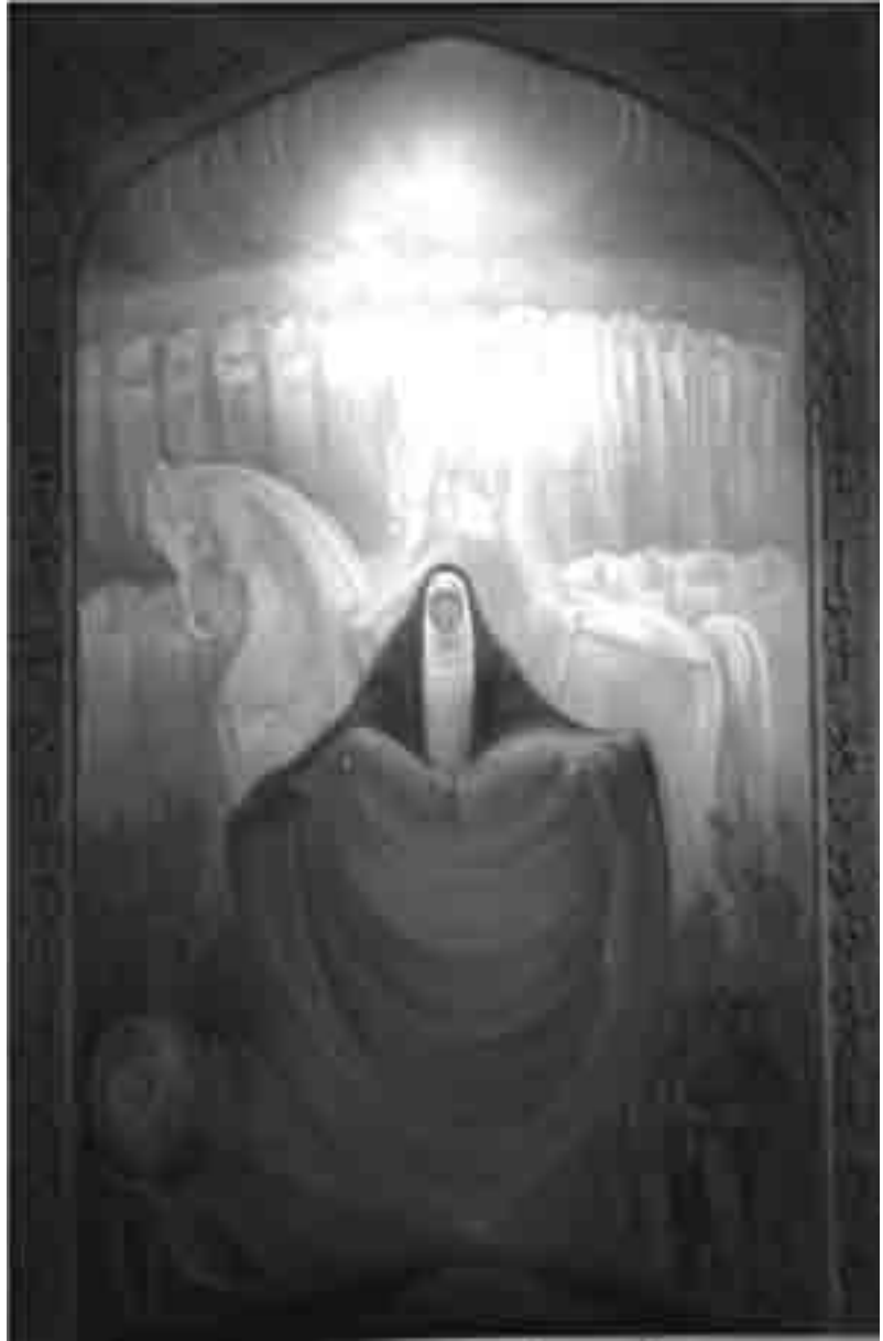
Influencias del muralismo mexicano en otras latitudes