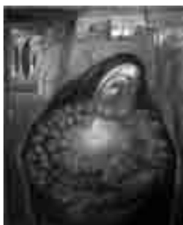
Kazem Chalipa, Martyr's Mother , oil on canvas, 120x180 cm

The white background depicts Islamic symbols of sacrifice and spirituality: front composition showing symbolic Iranian families attitude during the war.