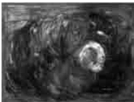
Habib Sadeghi, Martyr's funeral , oil on canvas, 80 x 120 cm, 1988

Imam Hossein the symbol of virtue and sanctity, and Shemr, the portrait of vice and mischief. The forms, colors and composition show the eternal battle between the virtue and vice. This painting depicts to the audience the two aspects of the human way of life.