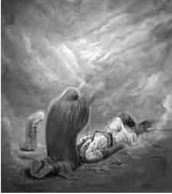
Hossein Khosrojerdi, La noche de Ashura , 1990, óleo sobre tela, 120 x 140 cm.

Las tres figuras en la pintura representan: El martirio (Retrato de Iman Hossein). El mensaje de los mártires traído por la hermana de Iman Hossein. El símbolo de la continuación del suceso, la hija de Iman Hossein. Las formas, el color y la luz en el fondo representan el dolor y el sufrimiento.