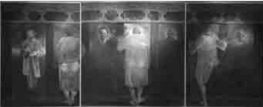
Hossein Khosrojerdi, Lectura revolucionaria y fanática del Islam , 1979, óleo sobre tela, 120 x 300 cm.

Las tres figuras en la pintura representan: El martirio (Retrato de Iman Hossein). El mensaje de los mártires traído por la hermana de Iman Hossein. El símbolo de la continuación del suceso, la hija de Iman Hossein. Las formas, el color y la luz en el fondo representan el dolor y el sufrimiento.