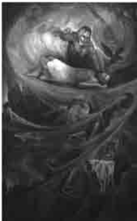
Historia de Caín y Abel, óleo sobre tela, 120 x 200 cm.

La batalla eterna entre las virtudes y los vicios en diferentes épocas de la historia de la humanidad es representada simbólicamente en este trabajo. Las formas, los colores y la composición muestran todos los elementos universales en la raíz de todos los conflictos mundiales.