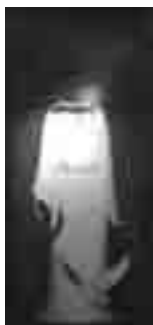
Nasser Palangi, Martyrdom for the cause of God , oil on canvas, 120 x 280 cm, 1980

This painting represents the relationship and connection between the history of Ashora and Iranian revolution with several traditional and contemporary icons and symbols.