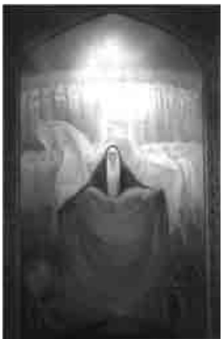
Kazem Chalipa, Madre mártir, 1979, óleo sobre tela, 180 x 280 cm.

La batalla eterna entre las virtudes y los vicios en diferentes épocas de la historia de la humanidad es representada simbólicamente en este trabajo. Las formas, los colores y la composición muestran todos los elementos universales en la raíz de todos los conflictos mundiales.