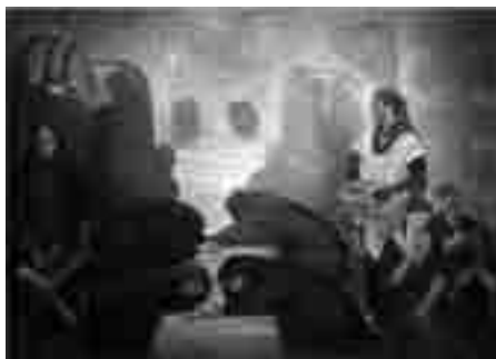
Kazem Chalipa, Grieving for the Martyr , oil on canvas, 1991

The white background depicts Islamic symbols of sacrifice and spirituality: front composition showing symbolic Iranian families attitude during the war.