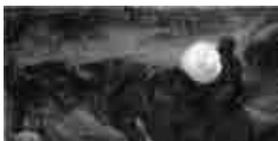
Habib Sadeghi, The face of Imam Hossein , oil on canvas, 1990

Costume, symbol of martyrs Blood, symbol of sacrifice Olive branch, symbol of peace Sword, symbol of defense. The white dove, symbol of peace, and spiritual message.