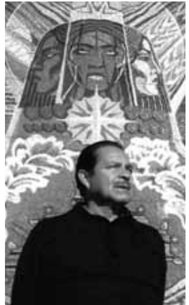
El pintor Salvador Almaraz