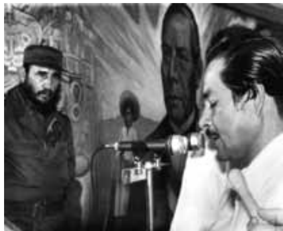
Castro en la inauguración del mural en la Escuela Benito Juárez en Cuba.