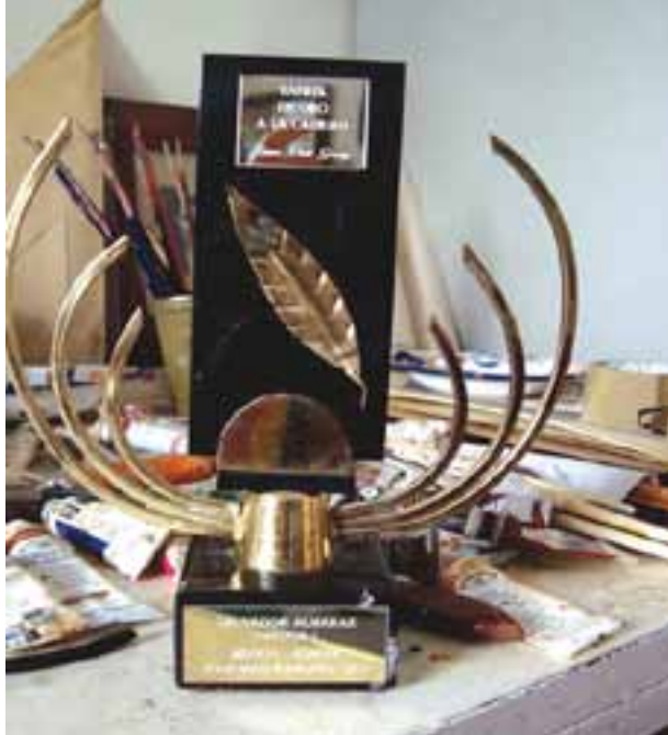
Reconocimiento Laurel de Oro a la Calidad.