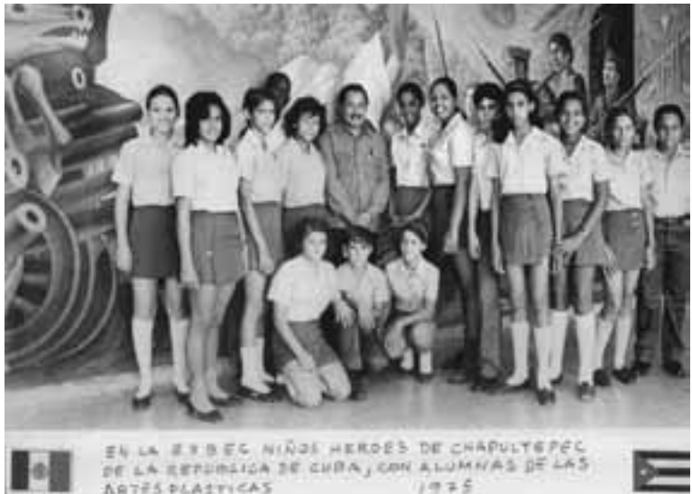
En la ESBEL Niños Héroes de Chapultepec de la República de Cuba, con alumnas de las artes plásticas, 1975.