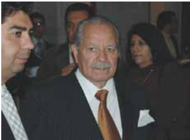
Reconocimiento por su trayectoria y aportación artística al arte mexicano, que le rindieron las autoridades de cultura de Guanajuato en 2008.