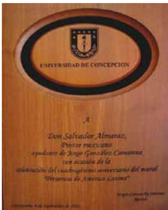
Reconocimiento de la Universidad de Concepción, Chile, 2005.