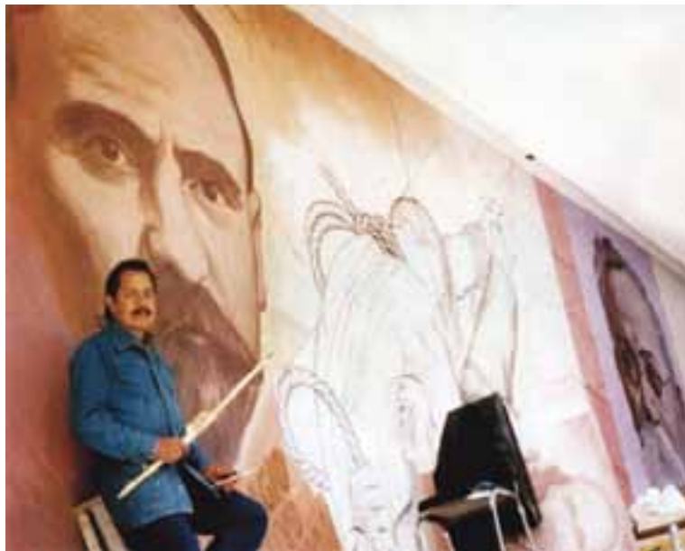
Almaraz en Cuba.

Actualmente es uno de los artistas en activo, a quien en vida ha sido muy importante y significativo reconocer y homenajear: