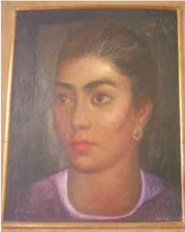
Retrato de su esposa.