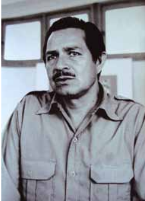
Salvador Almaraz en los sesenta.

Ha presentado numerosas exposiciones individuales y colectivas en su estado natal, en la ciudad de México y en otras entidades de nuestro país, así como en Cuba y Chile, por ejemplo.