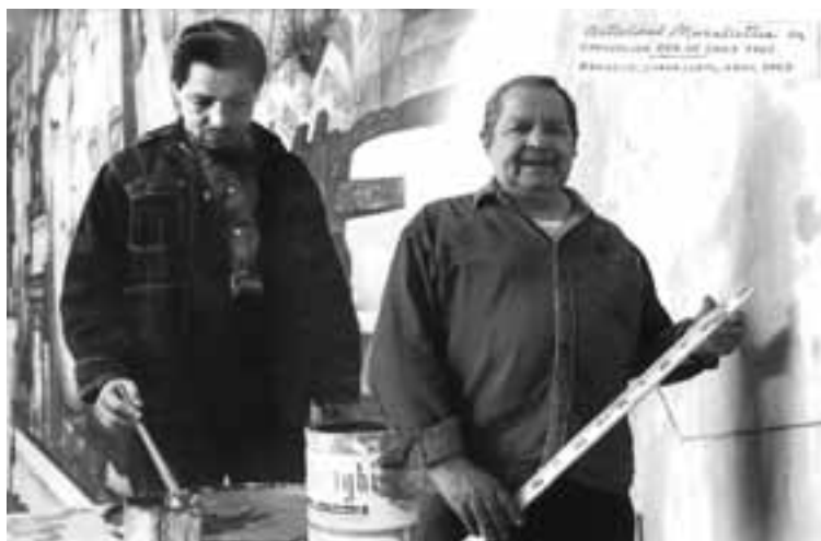
En plena labor en Chile y trabajando en Abasolo, Guanajuato.