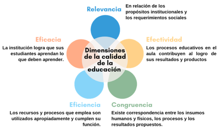
Figura 1: Dimensiones de la calidad de la educación superior

La educación es un bien público al que no se puede renunciar y constituye un derecho humano fundamental. La Oficina de Educación de la Organización de las Naciones Unidas para la Educación, la Ciencia y la Cultura (UNESCO) 5 plantea que el ser humano se fortalece, crece y se desarrolla plenamente como persona y como especie al compartir y transmitir sus valores y cultura en beneficio del progreso de la sociedad a través de la calidad de la educación recibida. Además, señala que la educación está conformada por cinco dimensiones esenciales y estrechamente relacionadas: