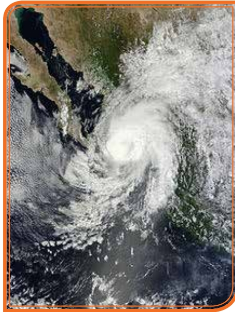
Huracán Emanuel