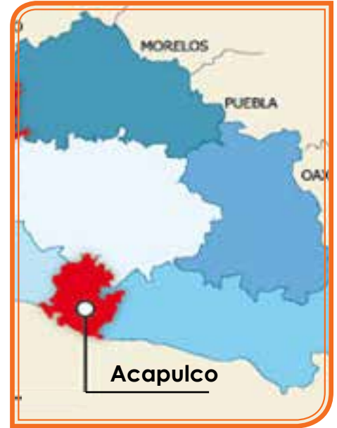
Mapa del municipio de Acapulco